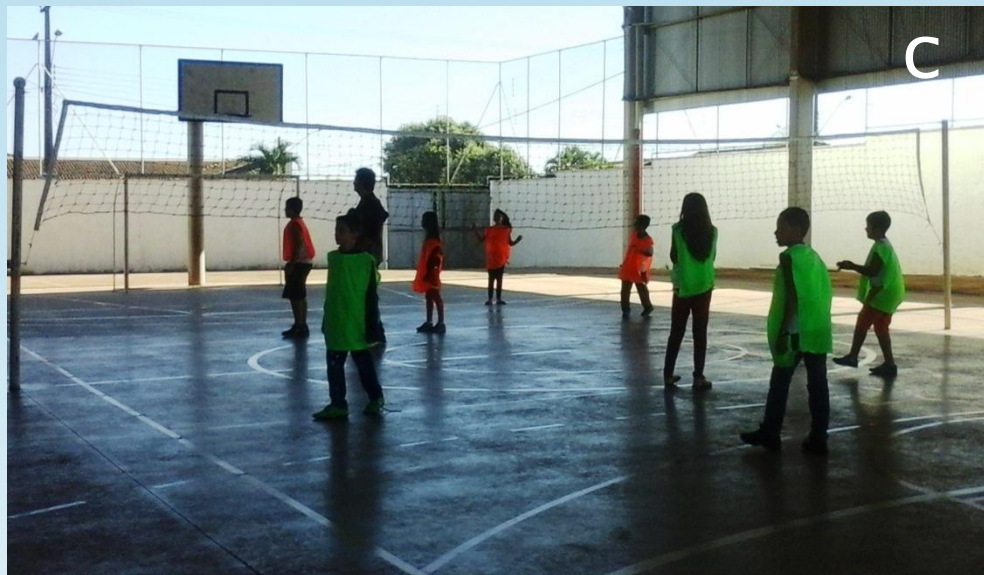
Figura – 8 A, 8 B e 8 C