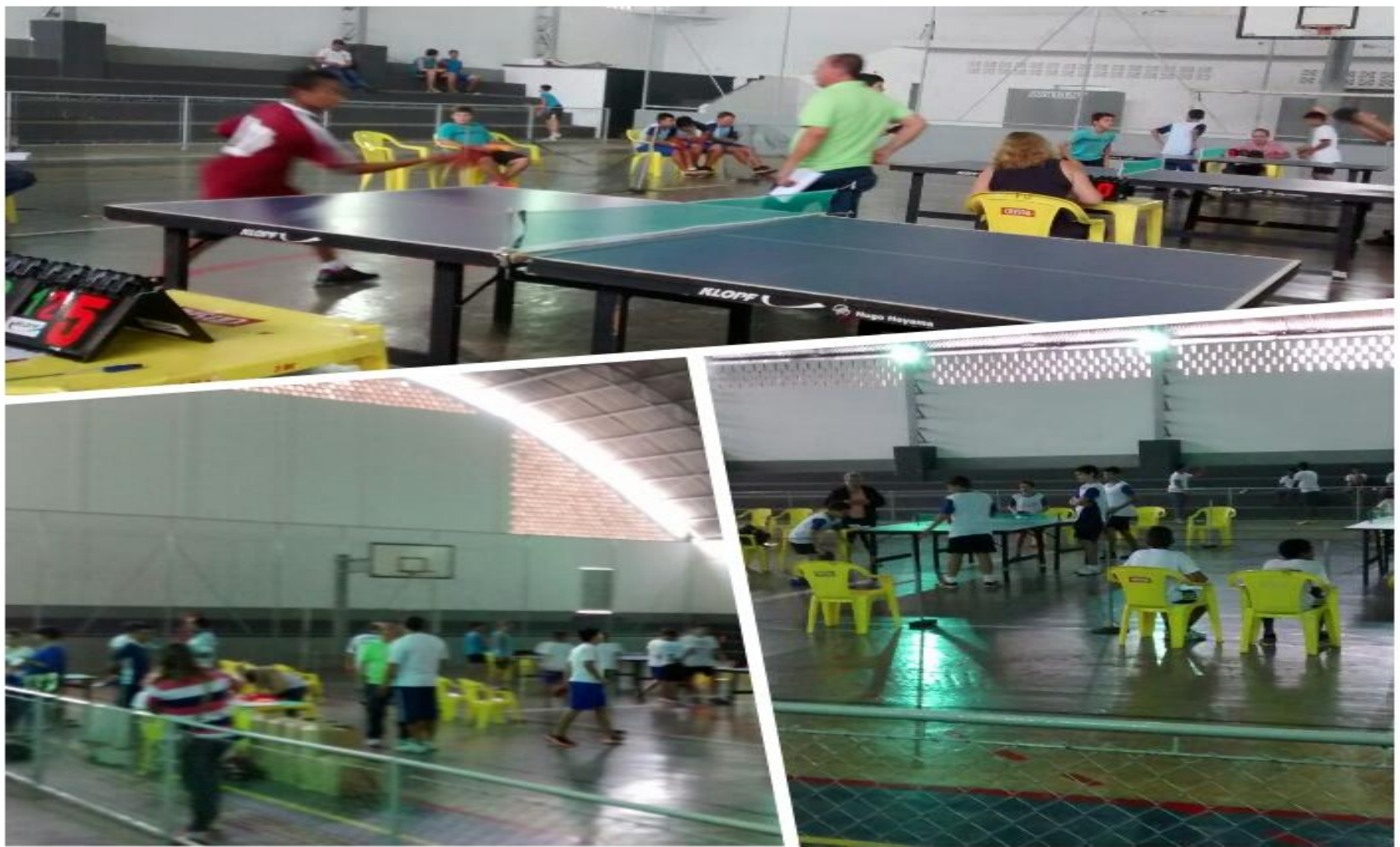
Figura - 11