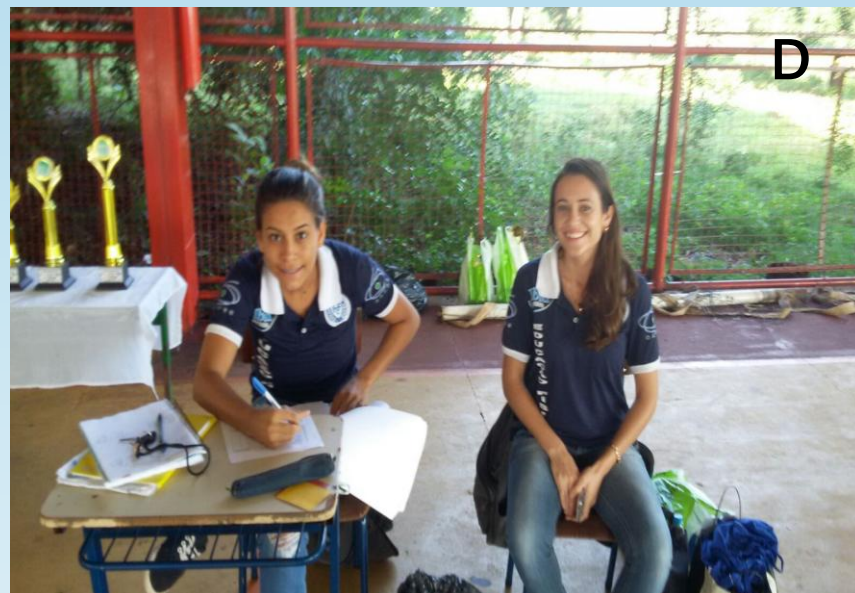
Figura – 3 A, 3 B, 3 C e 3 D