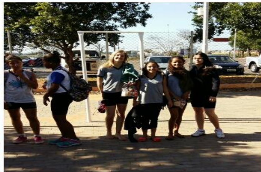
Figura – 12