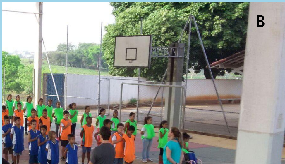
2º Lugar: Koei