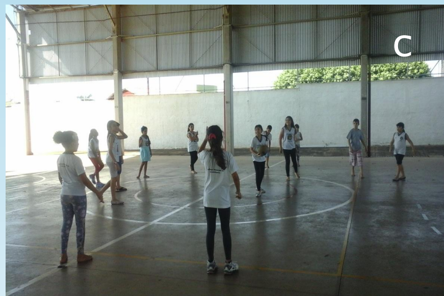
Figura – 2 A, 2 B e 2 C