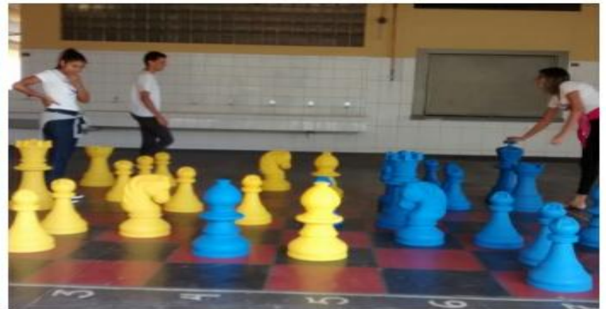
Figura – 9