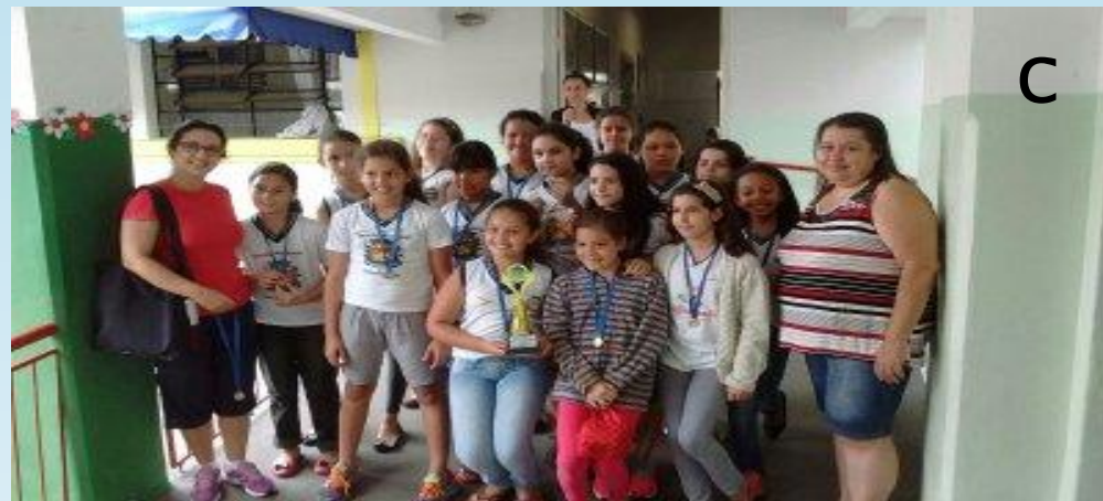
3º Lugar : Coronel