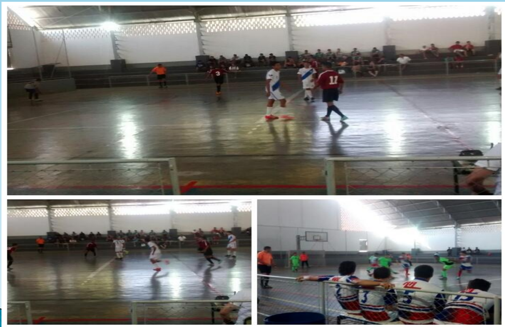
Figura - 10