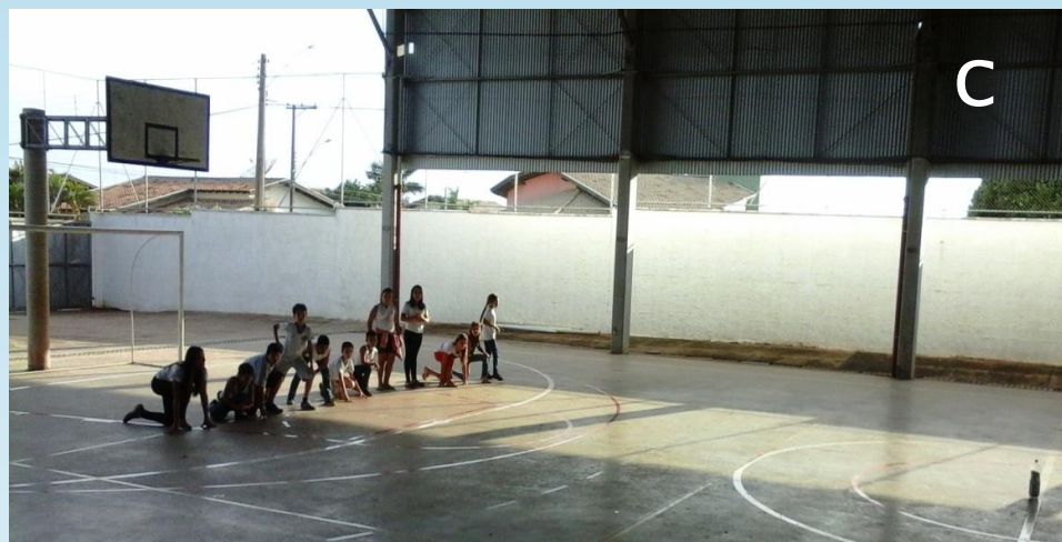
Figura – 3 A, 3 B e 3 C