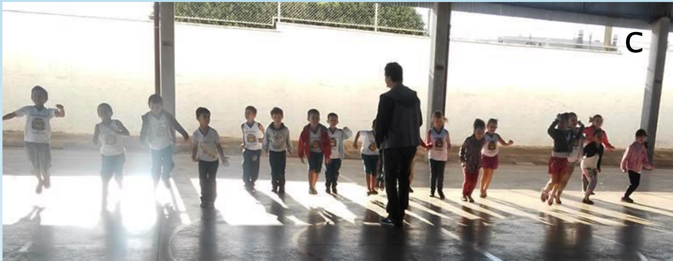
Figura – 4 A, 4 B e 4 C