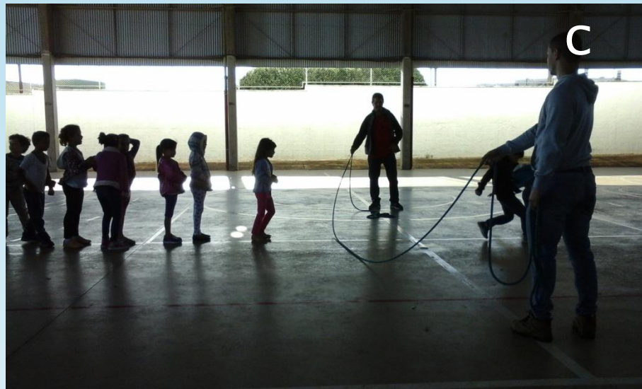
Figura – 5 A, 5 B e 5 C