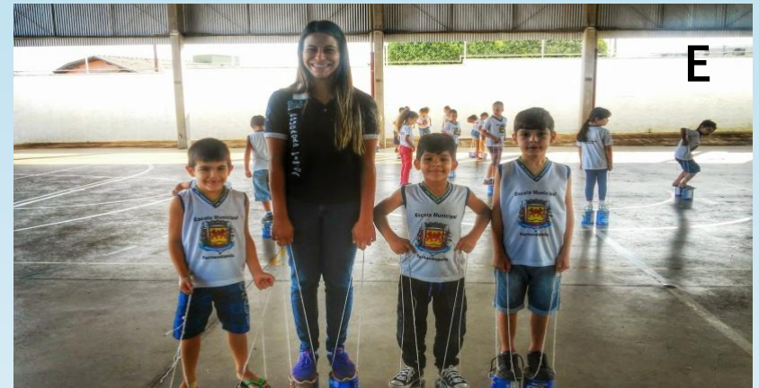
Figura – 6 A, 6 B, 6 C, 6 D e 6 E