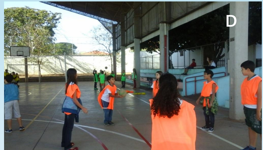
Figura 2 A, 2 B, 2 C e 2 D