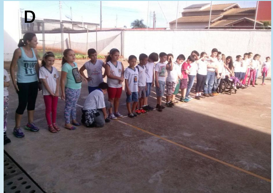
Figura – 1 A , 1 B , 1 C e 1 D