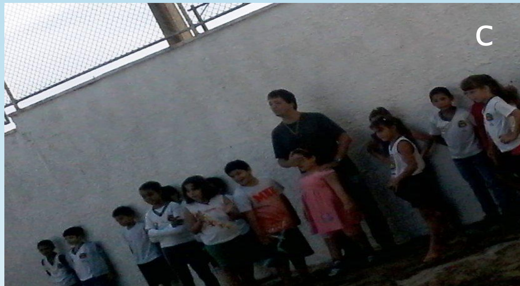
Figura – 6 A, 6 B e 6 C