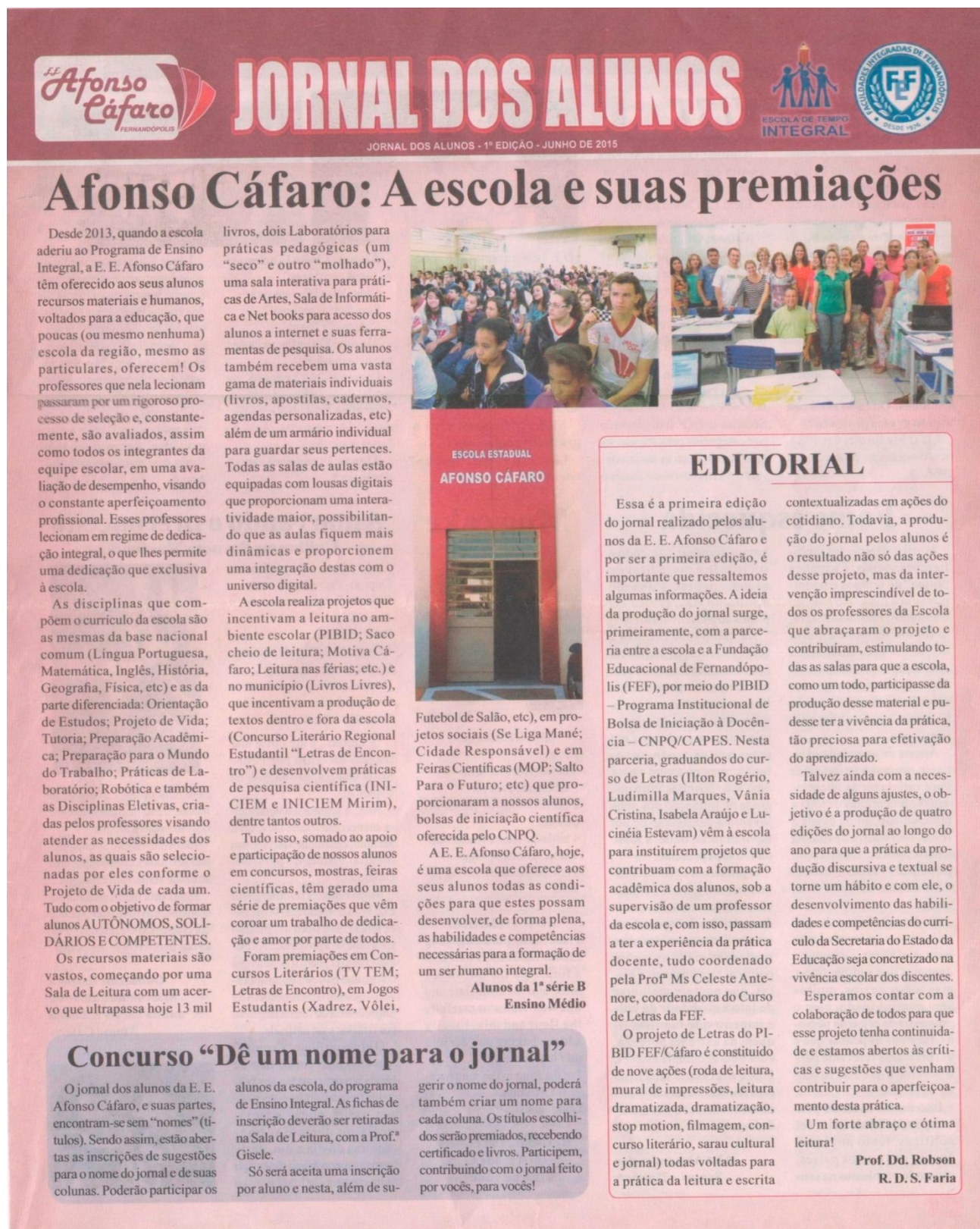
FIGURA 1 – Jornal – 1ª edição - página 1