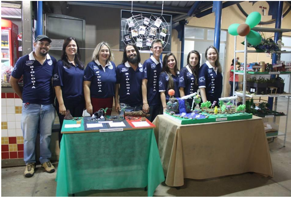
Foto 2: Apresentação da coordenadora institucional e de todos os integrantes do Subprojeto de Biologia: coordenadora de área, professora supervisora e alunos bolsistas, no III Encontro PIBID-FEF (III SIDFIFE).