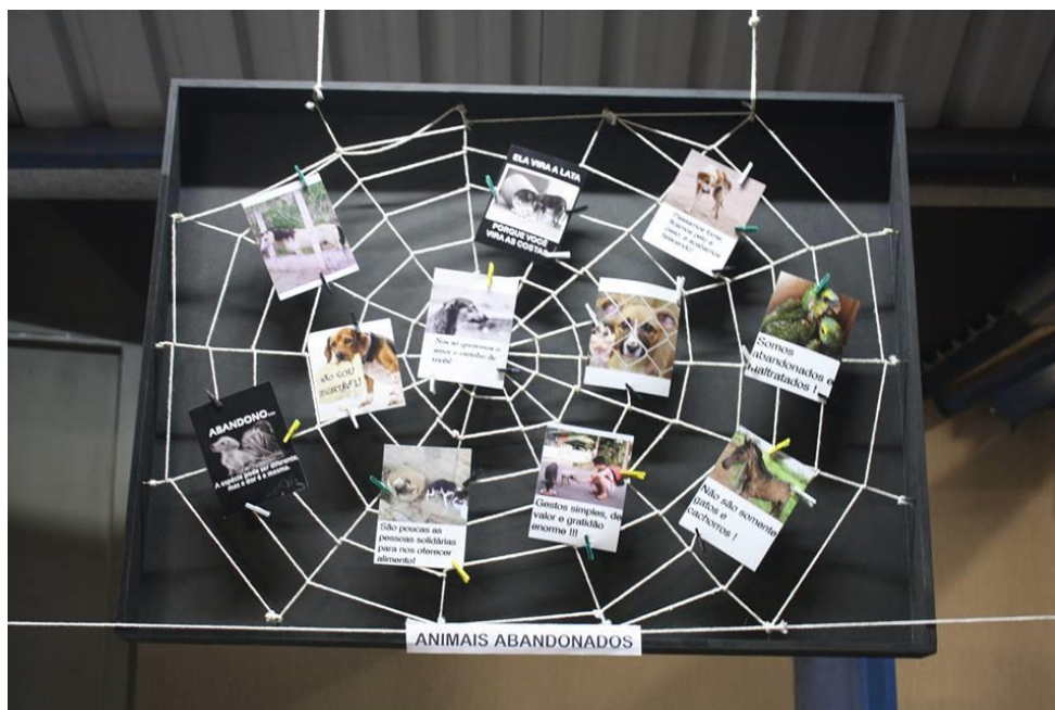
Foto 4: Exposição de painel de fotos de animais abandonados, no III Encontro PIBID-FEF (III SIDFIFE).