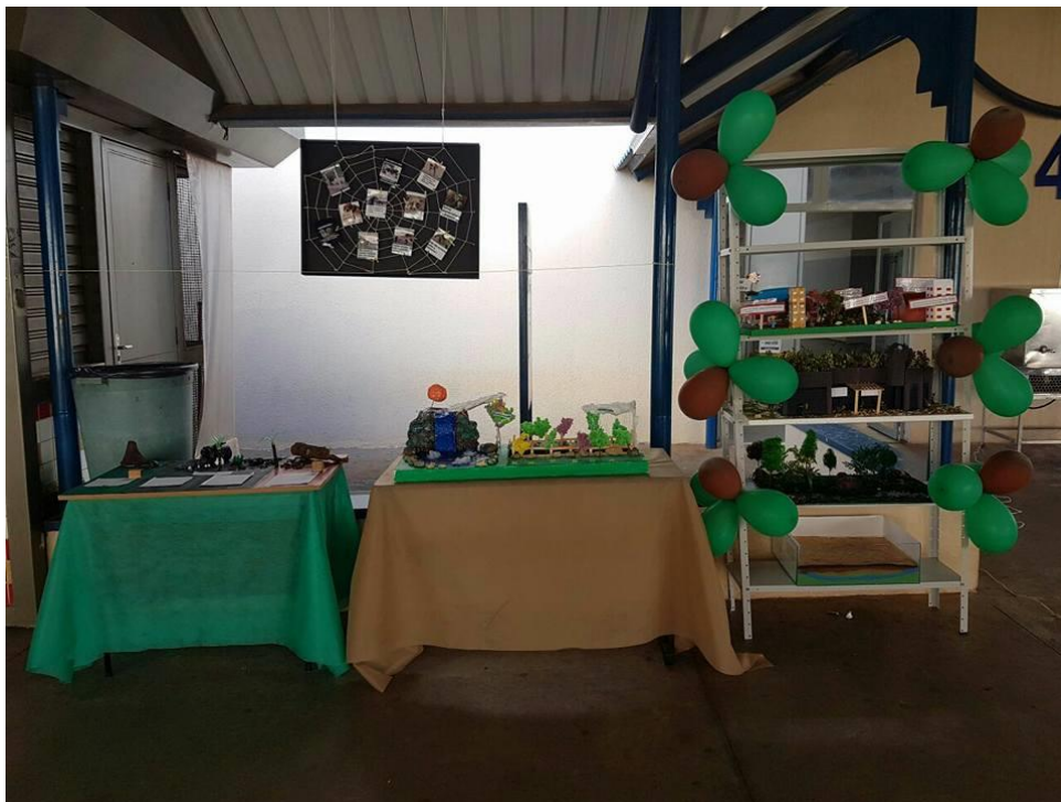
Foto 7: Exposição das maquetes dos animais sinantrópicos, do ciclo da água, dos biomas e do painel de animais abandonados, no III Encontro PIBID-FEF (III SIDFIFE).