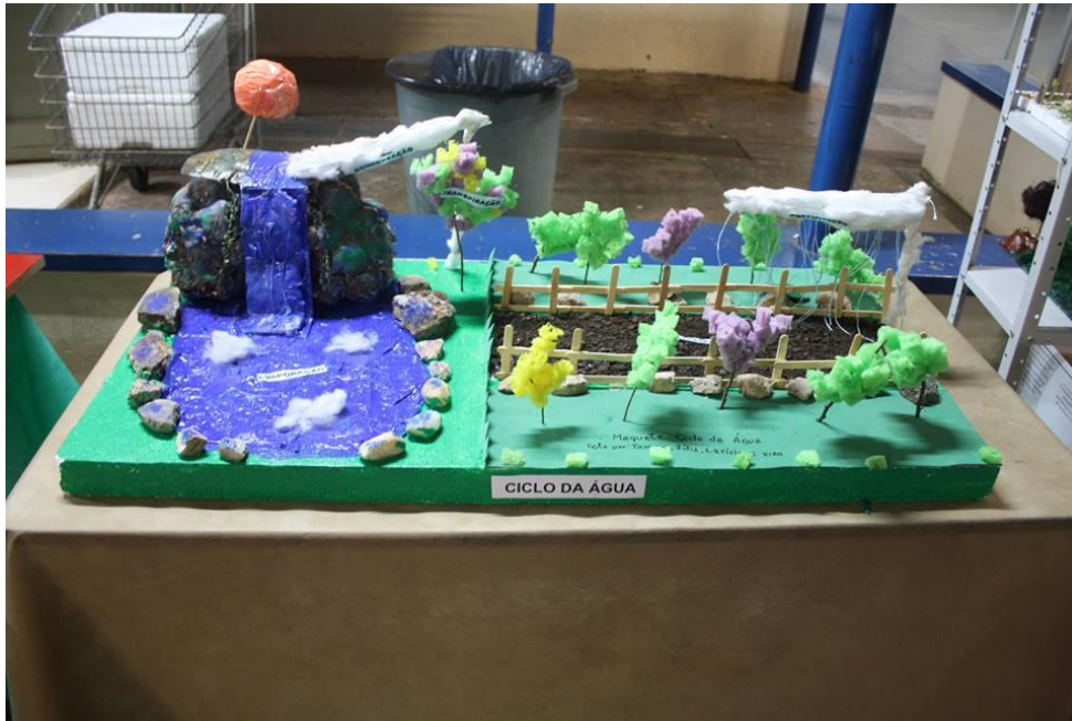
Foto 6: Exposição da maquete do ciclo da água, no III Encontro PIBID-FEF (III SIDFIFE).