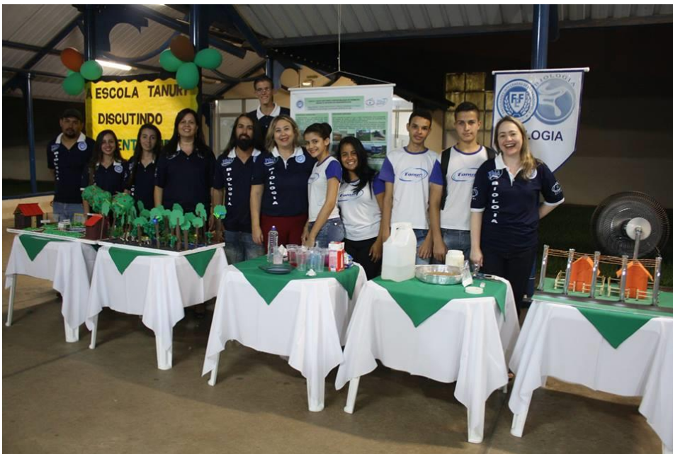
Foto 3: Apresentação da coordenadora institucional e de todos os integrantes do Subprojeto de Biologia: coordenadora de área, professora supervisora e alunos bolsistas, e também dos alunos da E.E. Professor Antônio Tanuri, no III Encontro PIBID-FEF (III SIDFIFE).