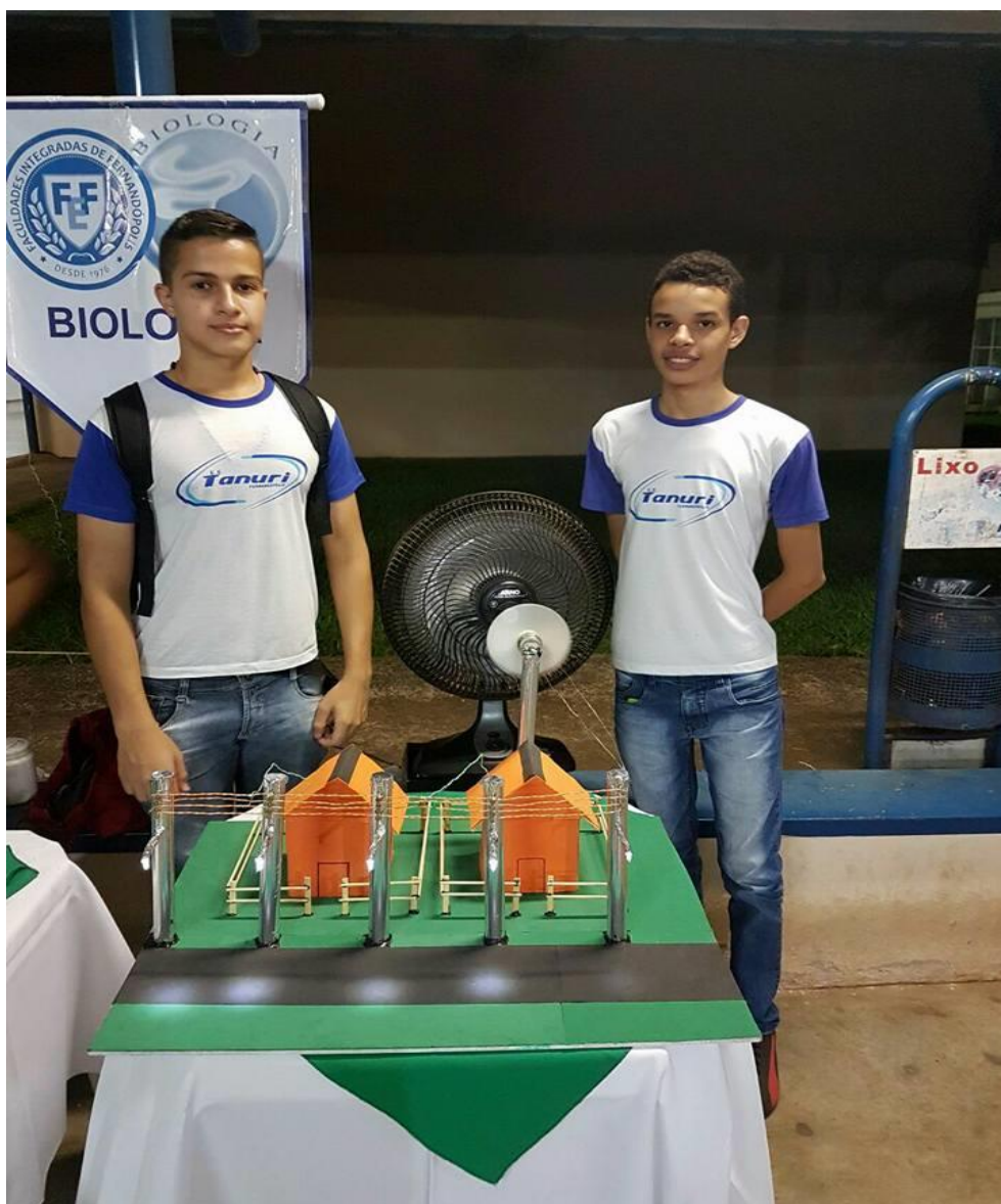
Foto 8: Exposição do experimento de energia eólica, pelos alunos educandos, no III ENCONTRO PIBID-FEF (III SIDFIFE).