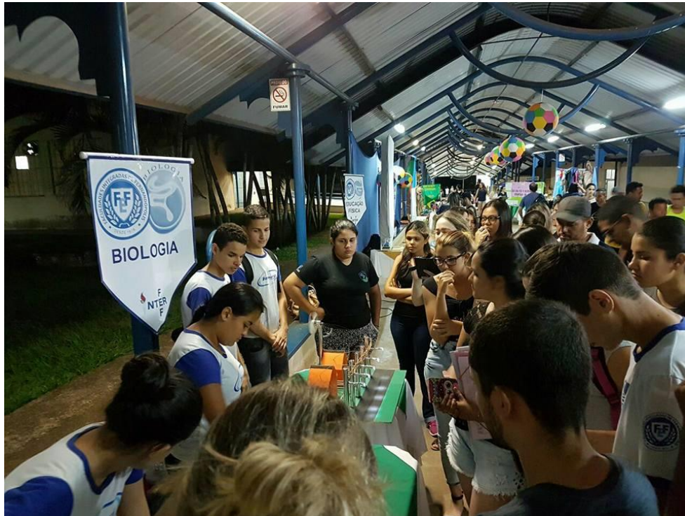
Foto 11: Exposição dos experimentos pelos alunos educandos, à comunidade universitária, no III ENCONTRO PIBID-FEF (III SIDFIFE).