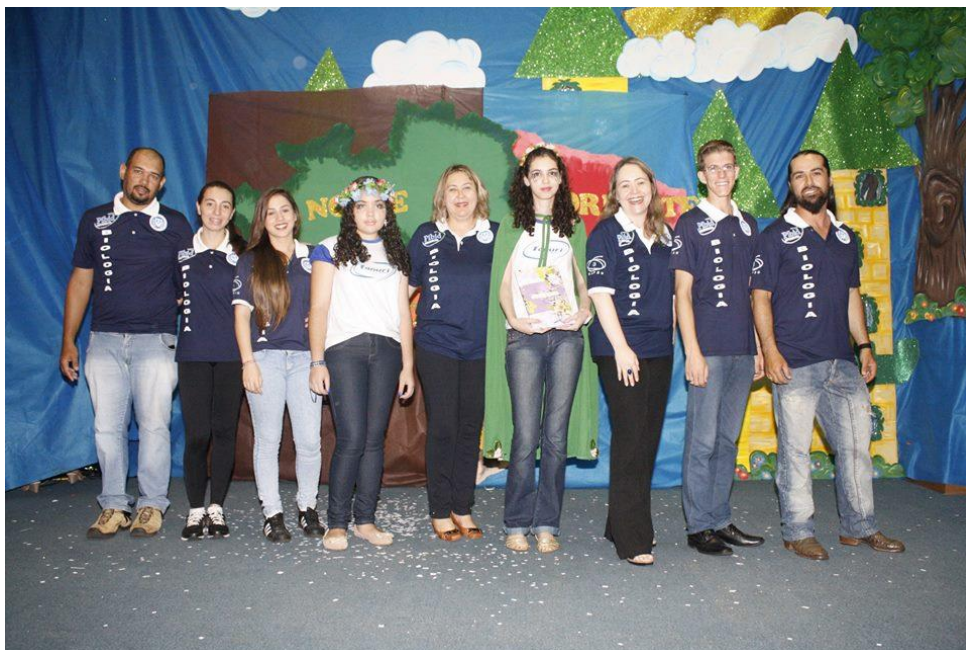
Foto 14: Apresentação de todos os integrantes do Subprojeto de Biologia: coordenadora de área, professora supervisora e alunos bolsistas, e também das alunas da E.E. Professor Antônio Tanuri , no III Encontro PIBID-FEF (III SIDFIFE).