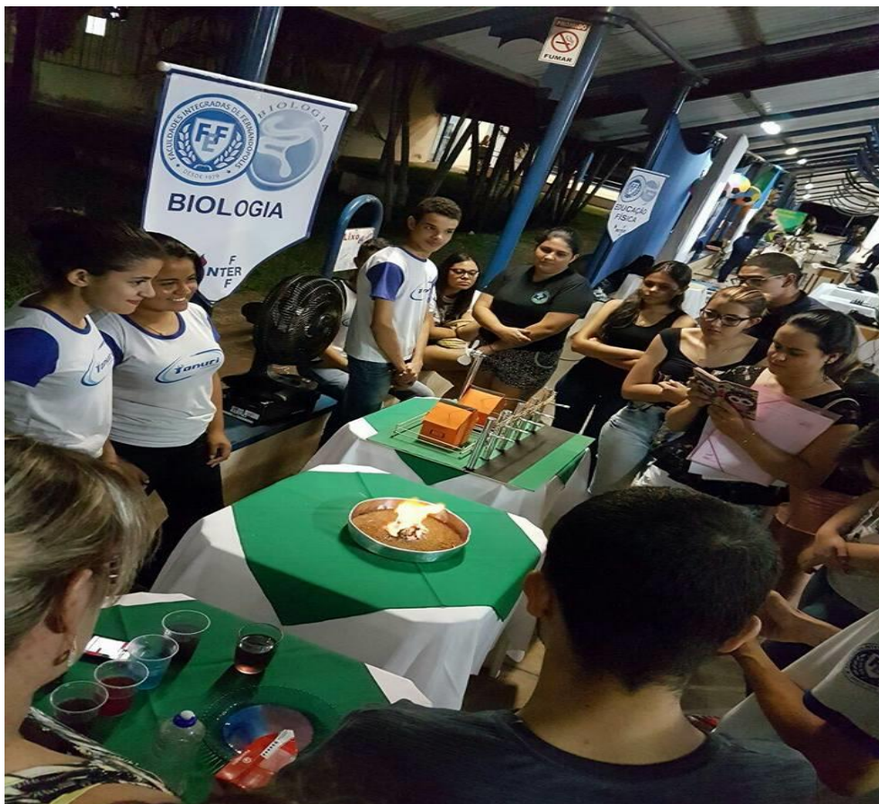
Foto 12: Exposição dos experimentos pelos alunos educandos, à comunidade universitária, no III ENCONTRO PIBID-FEF (III SIDFIFE).