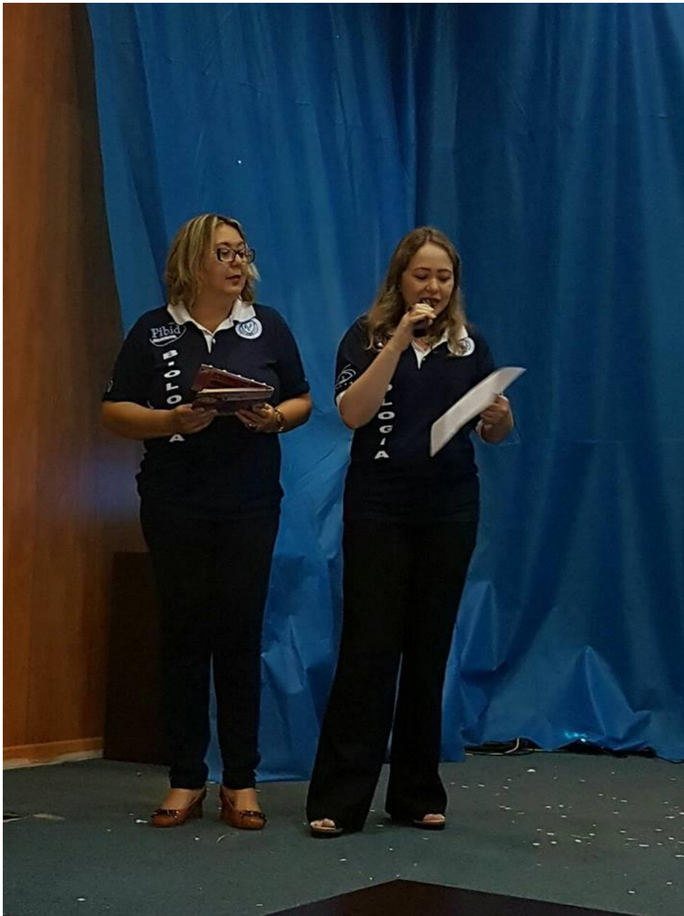
Foto 13: Apresentação da professora supervisora e da coordenadora de área do Subprojeto de Biologia, no III Encontro PIBID-FEF (III SIDFIFE).