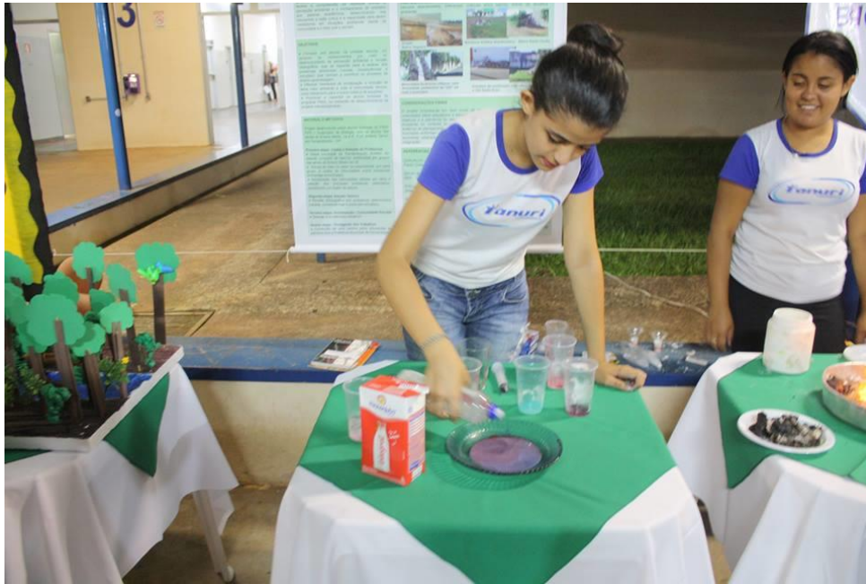
Foto 9: Exposição do experimento de tensão superficial, pelas alunas educandas, no III ENCONTRO PIBID-FEF (III SIDFIFE).