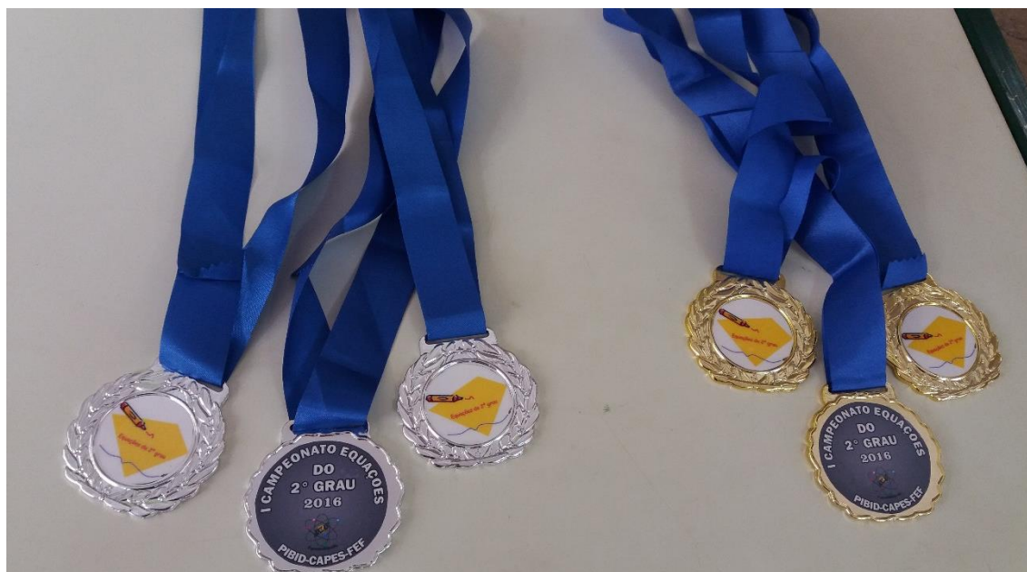
Foto 2: Medalhas ouro e prata das equipes que ficaram em 1º e 2º lugar.