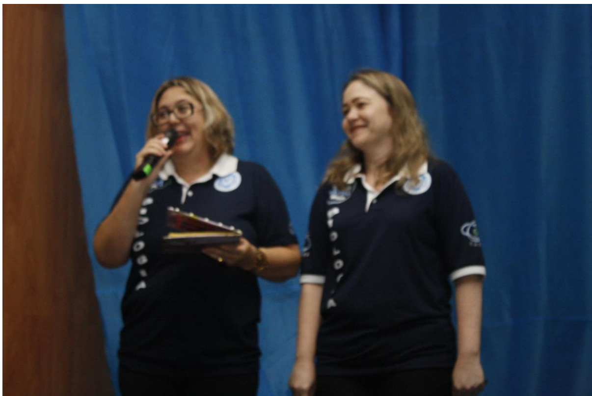
Foto 2: Apresentação dos resultados das ações desenvolvidas pelo subprojeto de Biologia.