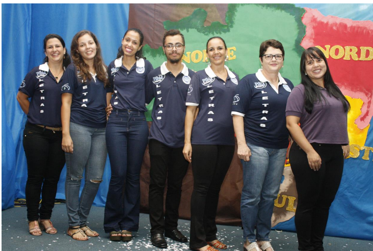
Foto 24: Apresentação dos resultados das ações desenvolvidas pelo subprojeto de Letras.