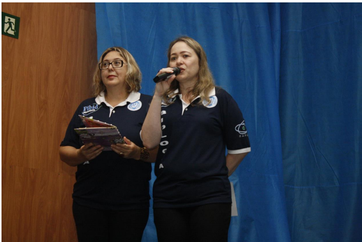
Foto 1: Apresentação dos resultados das ações desenvolvidas pelo subprojeto de Biologia.