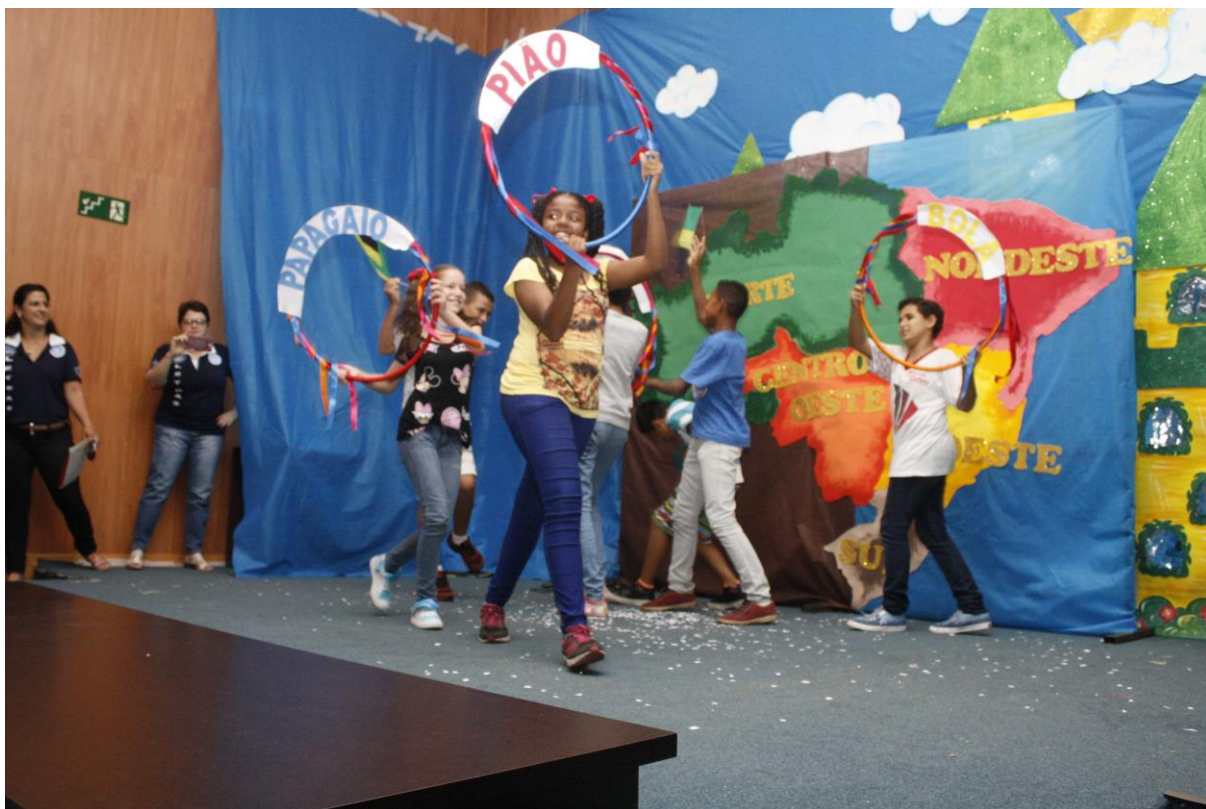
Foto 19: Apresentação dos resultados das ações desenvolvidas pelo subprojeto de Letras.