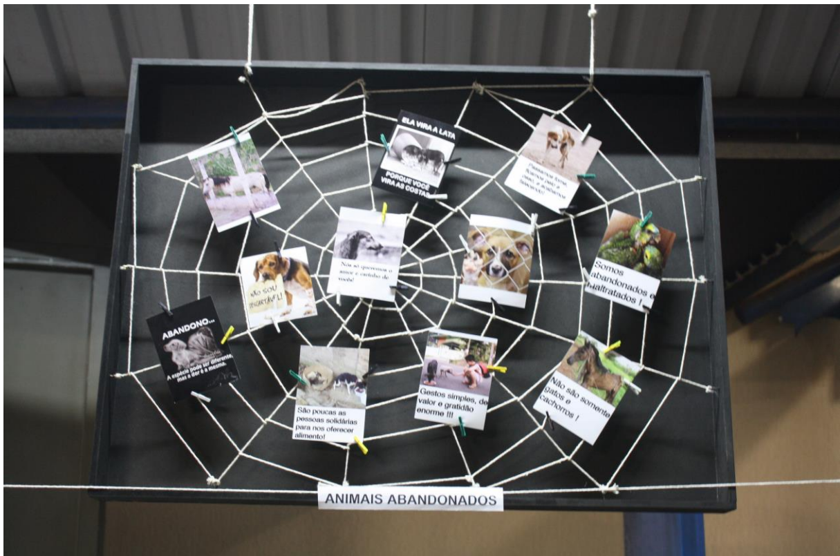
Foto 8: Apresentação dos resultados das ações desenvolvidas pelo subprojeto de Biologia.