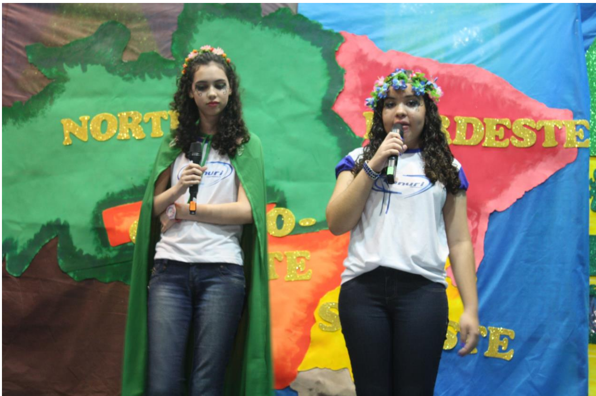
Foto 4: Apresentação dos resultados das ações desenvolvidas pelo subprojeto de Biologia.