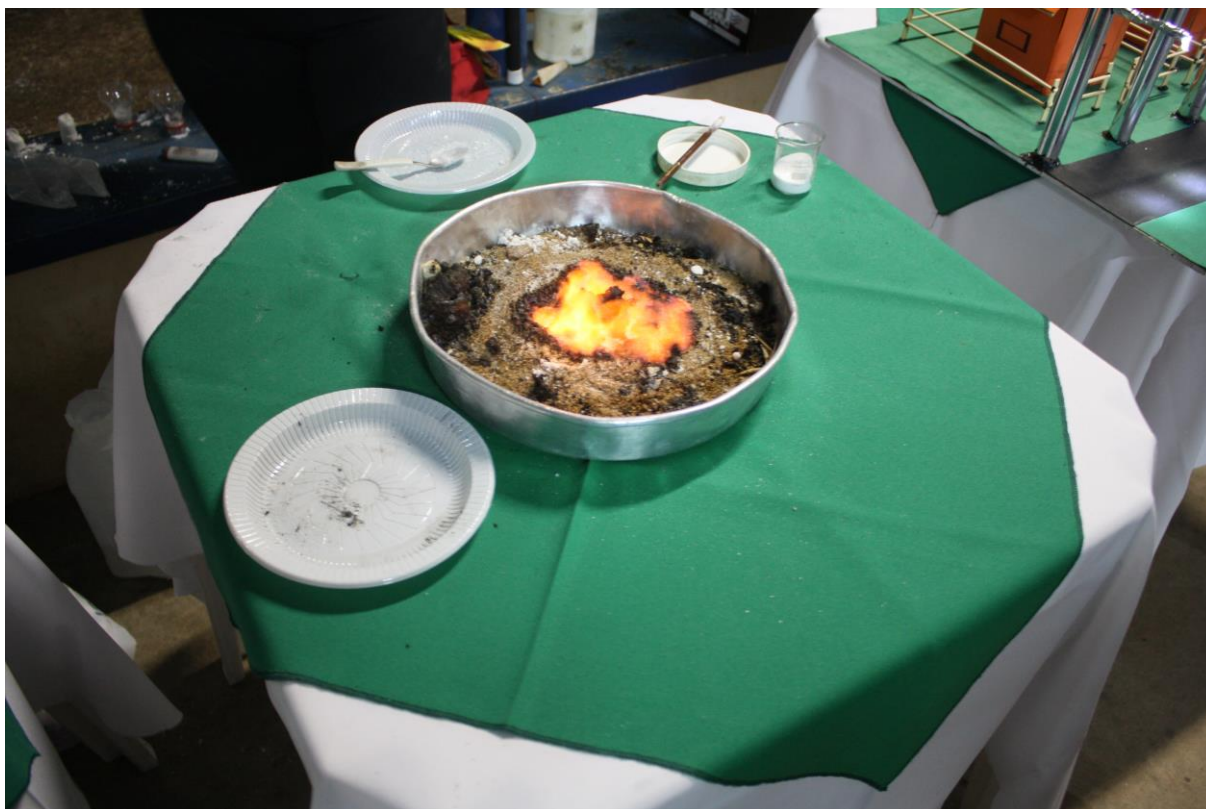
Foto 12: Apresentação dos resultados das ações desenvolvidas pelo subprojeto de Biologia.