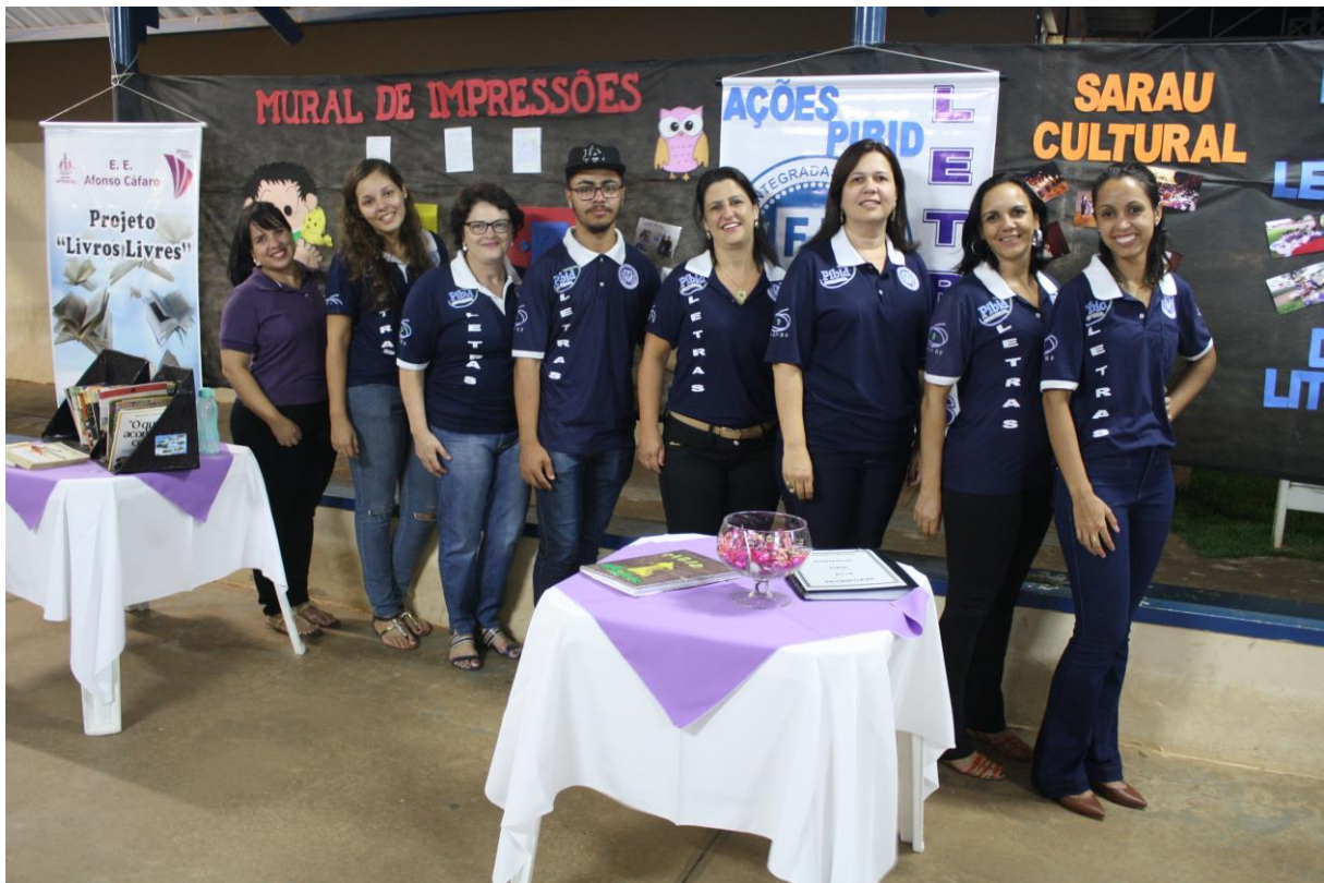
Foto 25: Apresentação dos resultados das ações desenvolvidas pelo subprojeto de Letras.