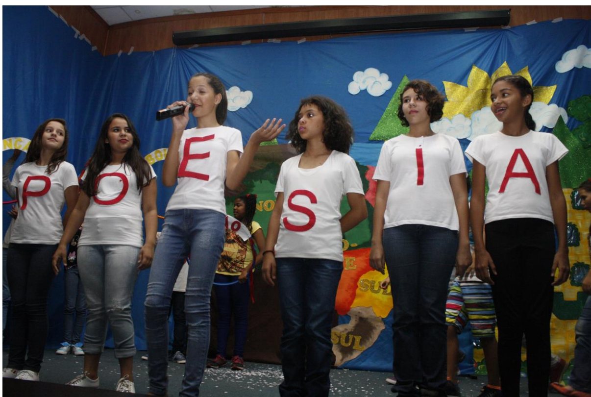
Foto 20: Apresentação dos resultados das ações desenvolvidas pelo subprojeto de Letras.