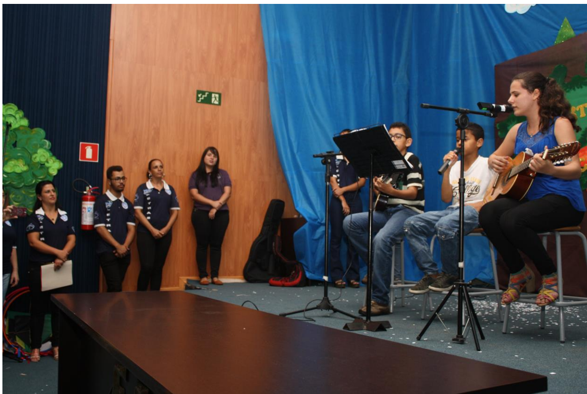
Foto 23: Apresentação dos resultados das ações desenvolvidas pelo subprojeto de Letras.