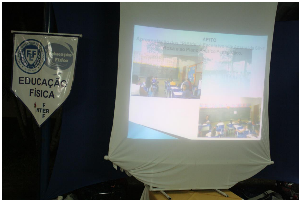
Foto 15: Apresentação dos resultados das ações desenvolvidas pelo subprojeto de Educação Física.