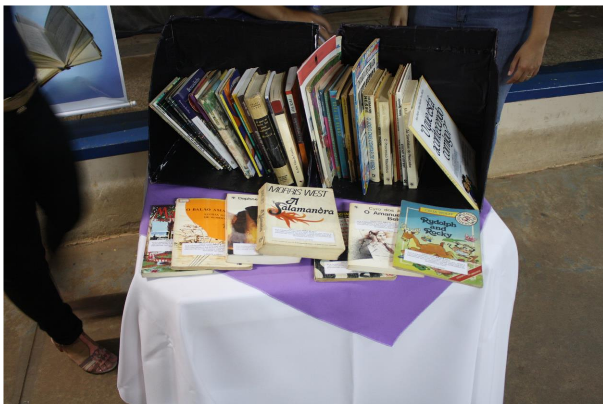
Foto 28: Apresentação dos resultados das ações desenvolvidas pelo subprojeto de Letras.