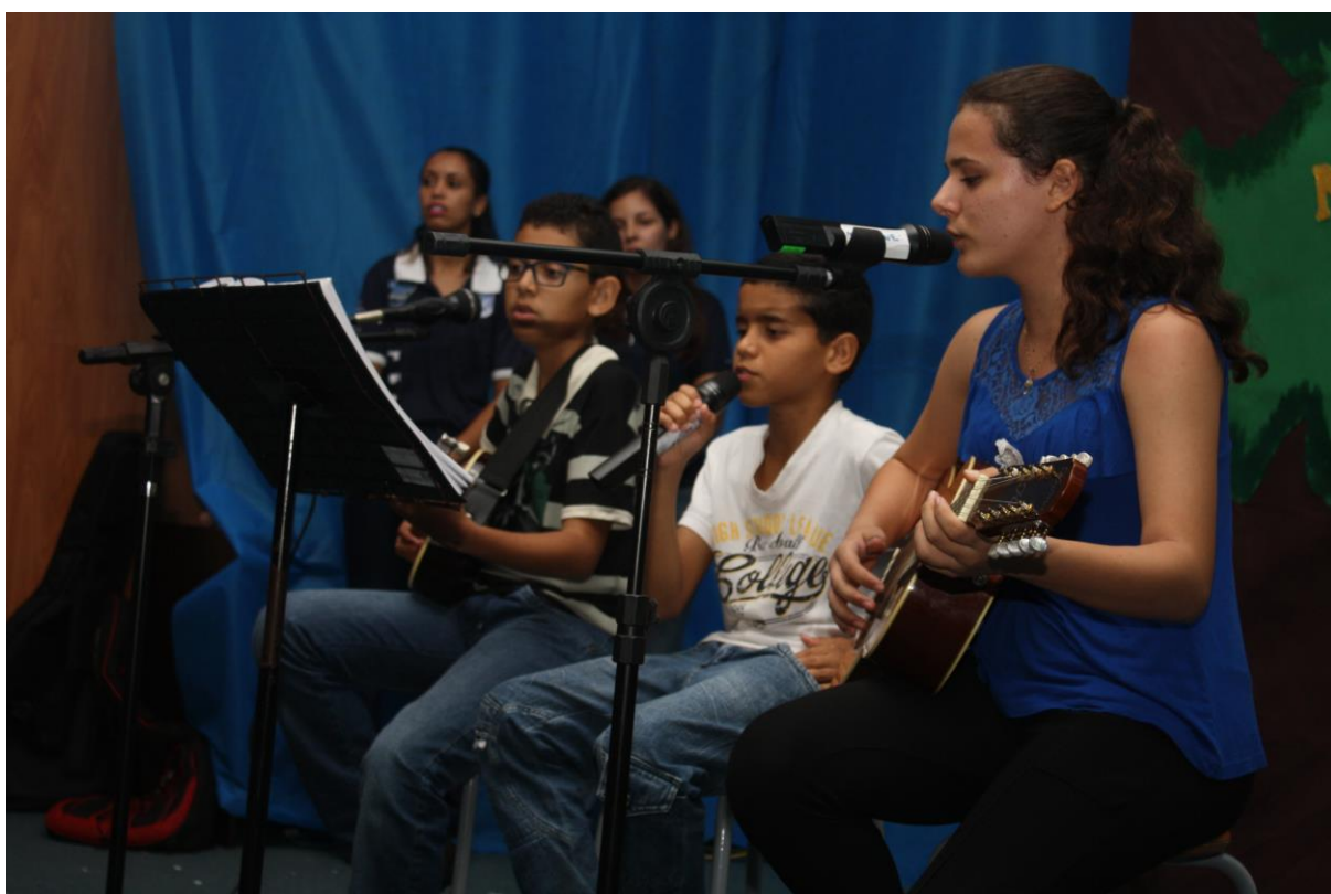
Foto 22: Apresentação dos resultados das ações desenvolvidas pelo subprojeto de Letras.