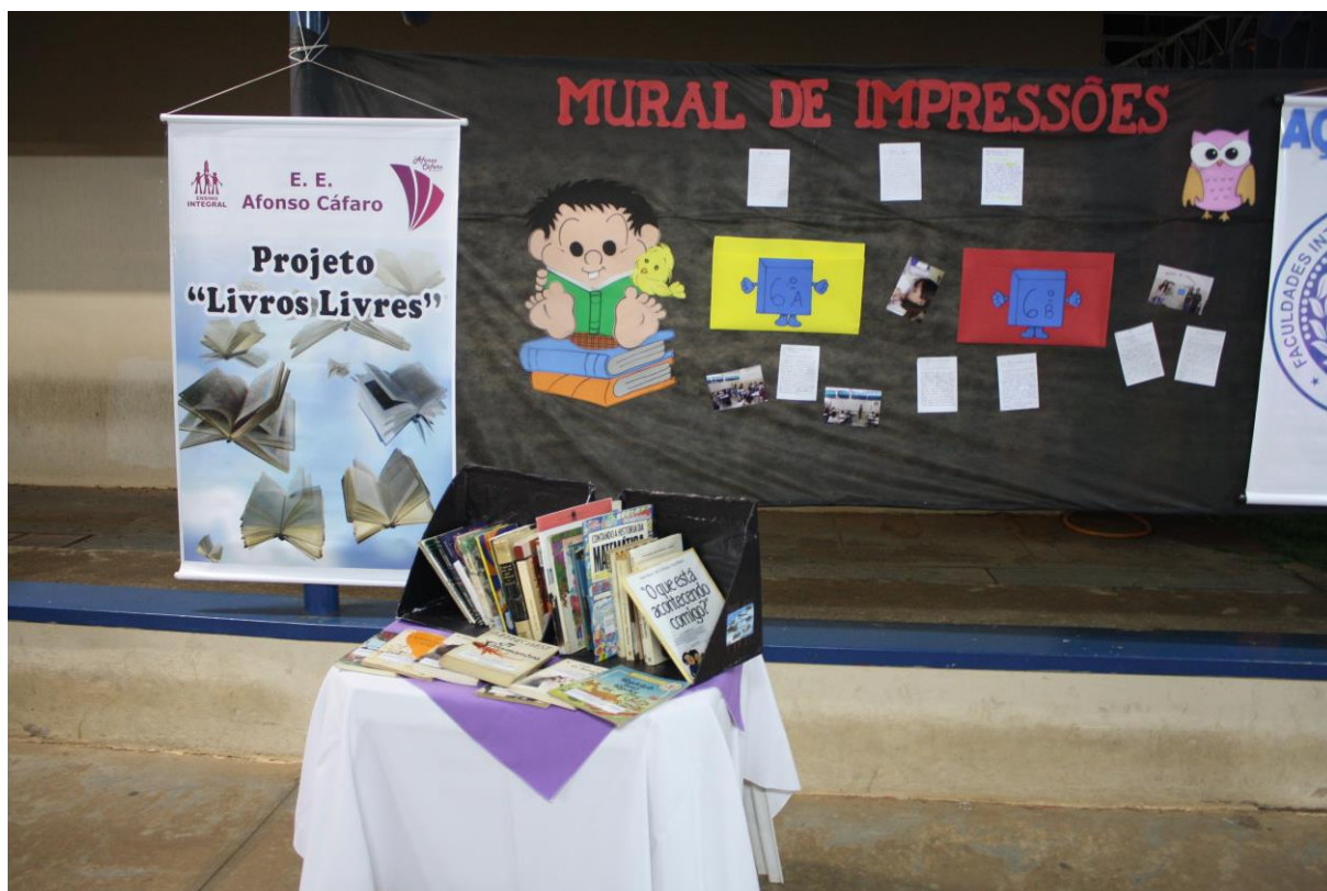
Foto 29: Apresentação dos resultados das ações desenvolvidas pelo subprojeto de Letras.