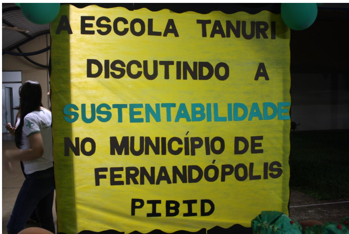
Foto 9: Apresentação dos resultados das ações desenvolvidas pelo subprojeto de Biologia.