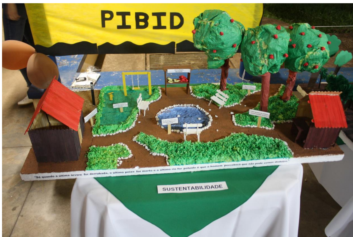
Foto 10: Apresentação dos resultados das ações desenvolvidas pelo subprojeto de Biologia.