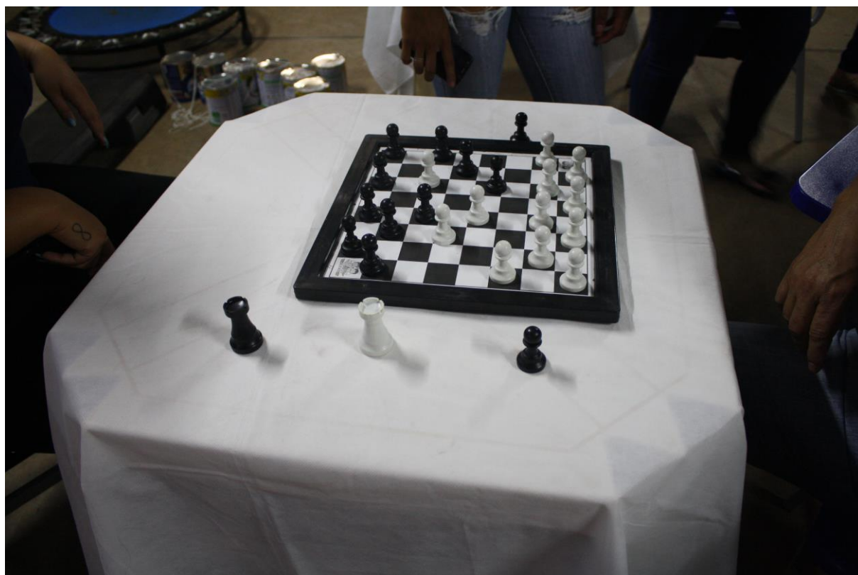
Foto 16: Apresentação dos resultados das ações desenvolvidas pelo subprojeto de Educação Física.