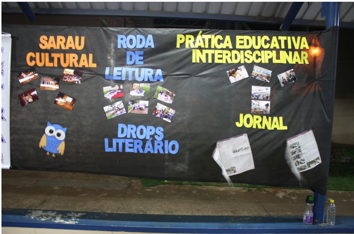
Foto 26: Apresentação dos resultados das ações desenvolvidas pelo subprojeto de Letras.