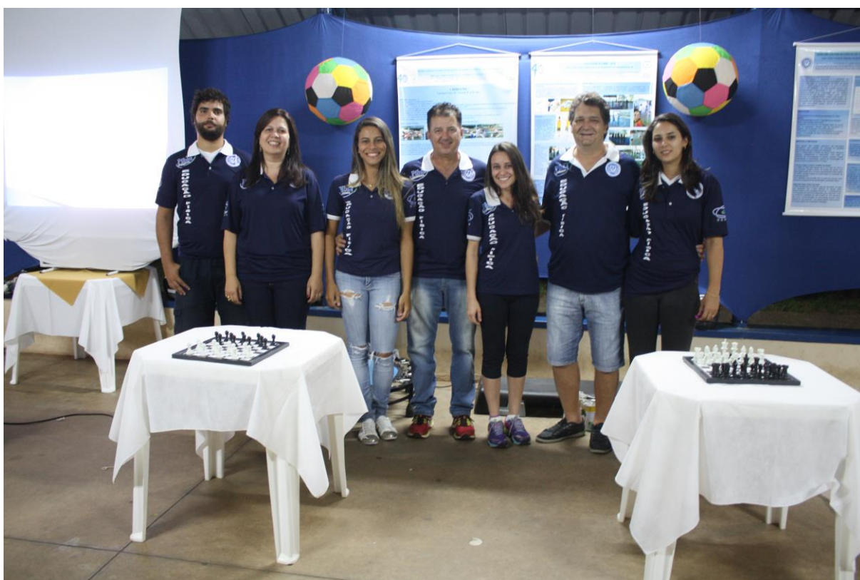
Foto 14: Apresentação dos resultados das ações desenvolvidas pelo subprojeto de Educação Física.