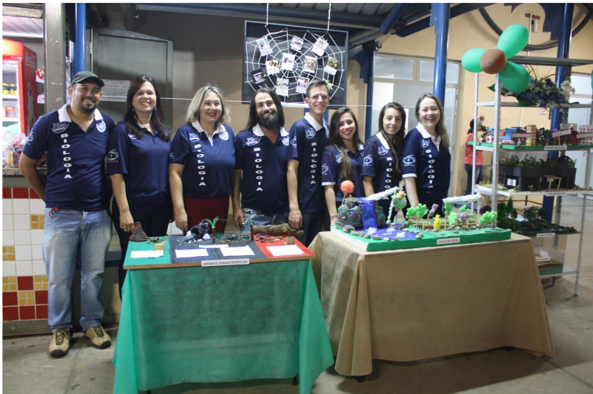
Foto 6: Apresentação dos resultados das ações desenvolvidas pelo subprojeto de Biologia.