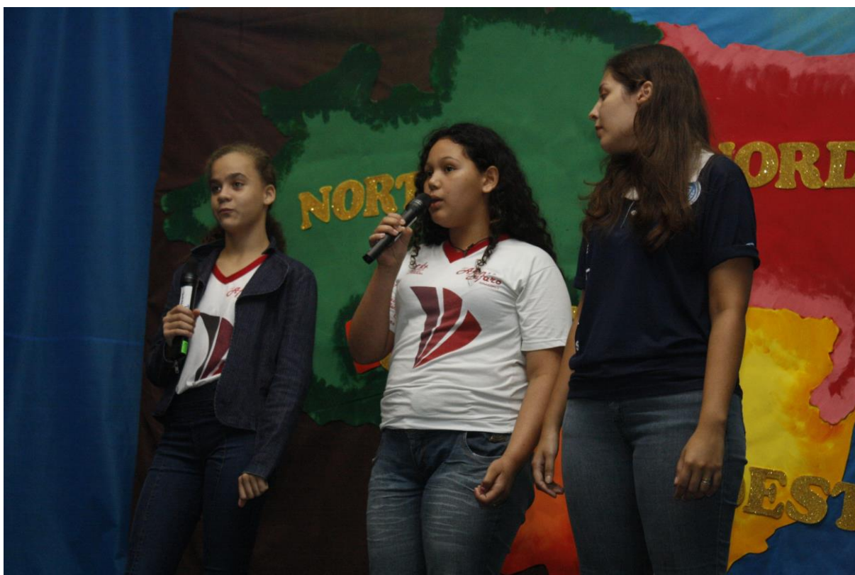
Foto 18: Apresentação dos resultados das ações desenvolvidas pelo subprojeto de Letras.