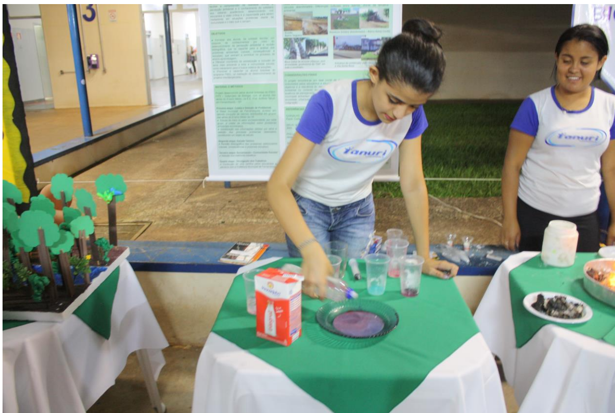
Foto 11: Apresentação dos resultados das ações desenvolvidas pelo subprojeto de Biologia.