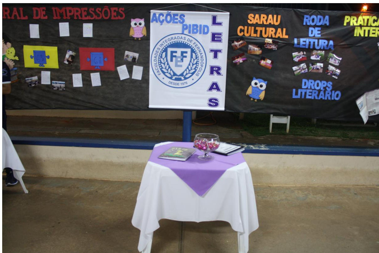
Foto 27: Apresentação dos resultados das ações desenvolvidas pelo subprojeto de Letras.