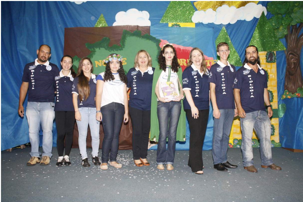
Foto 3: Apresentação dos resultados das ações desenvolvidas pelo subprojeto de Biologia.