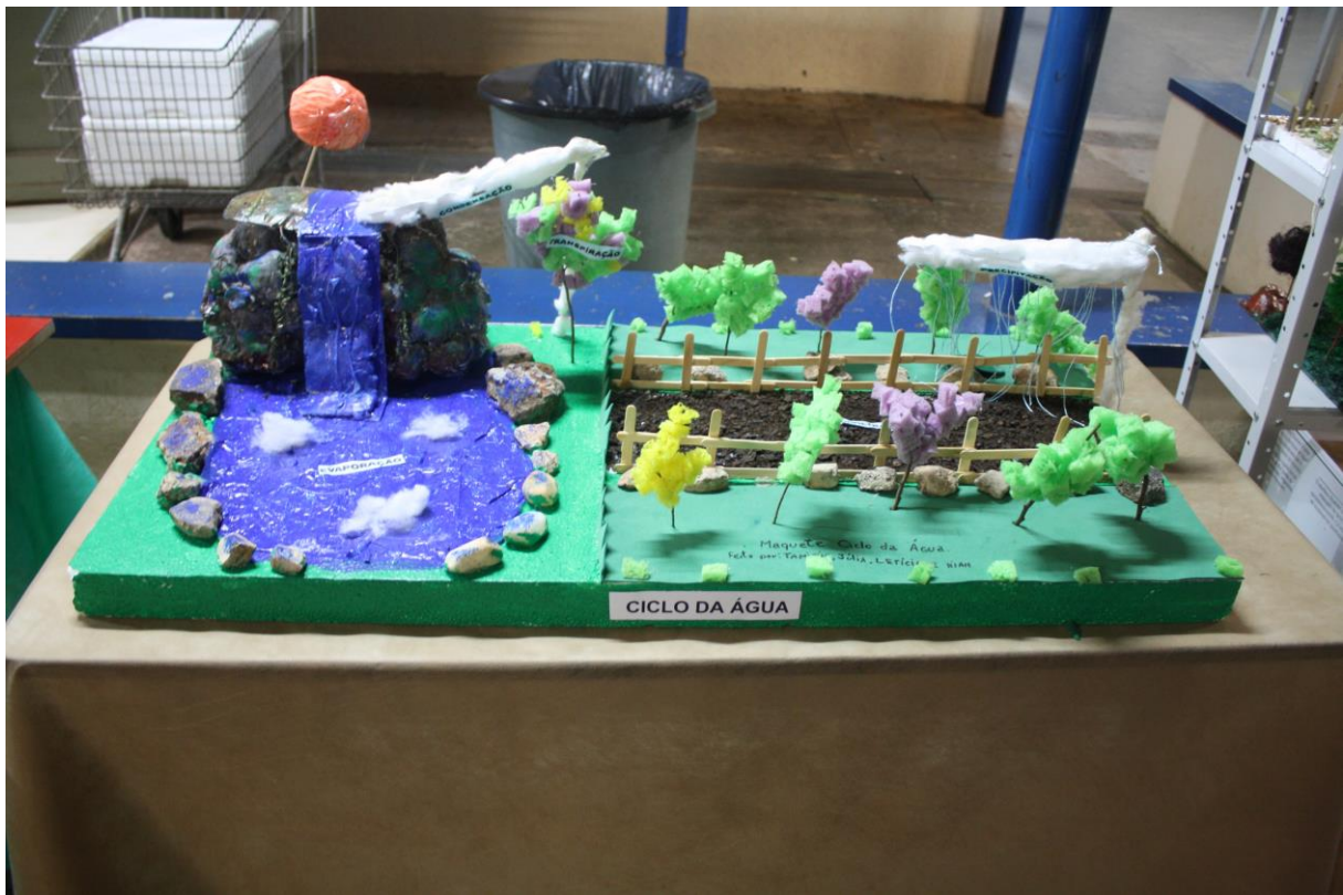
Foto 7: Apresentação dos resultados das ações desenvolvidas pelo subprojeto de Biologia.