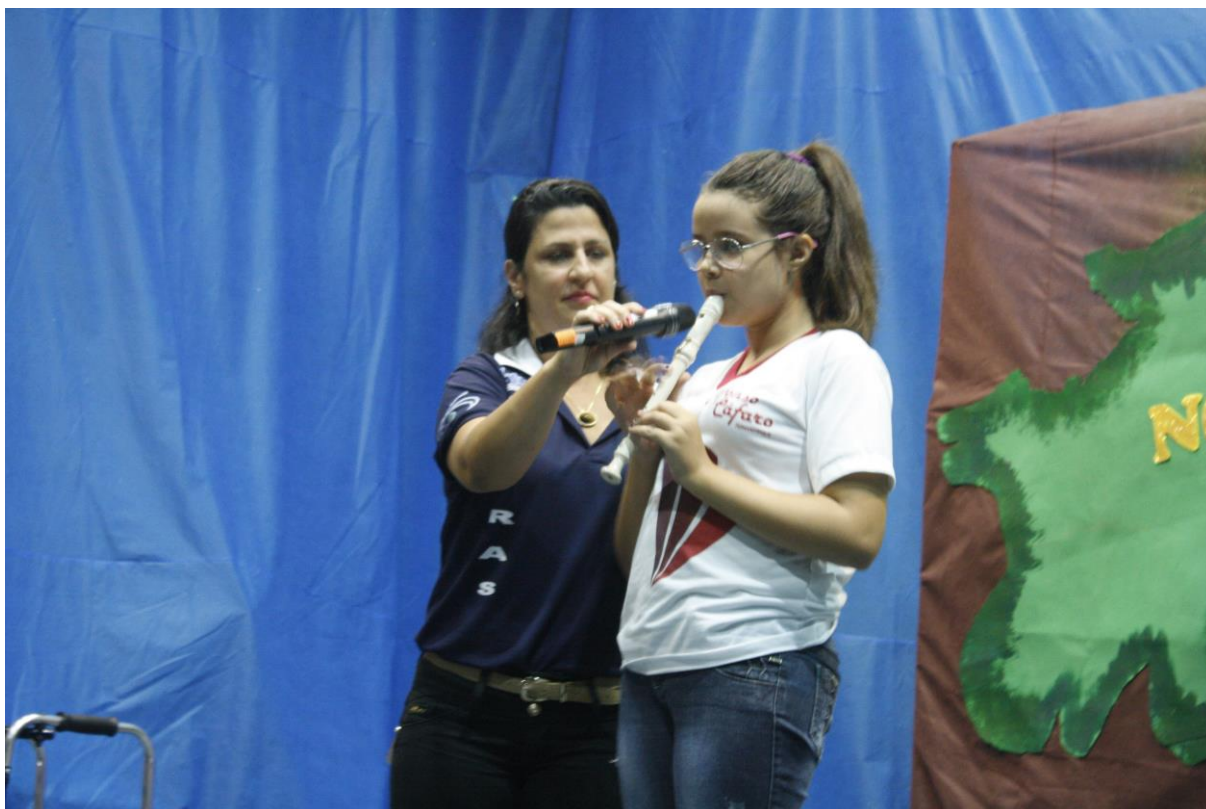
Foto 17: Apresentação dos resultados das ações desenvolvidas pelo subprojeto de Letras.