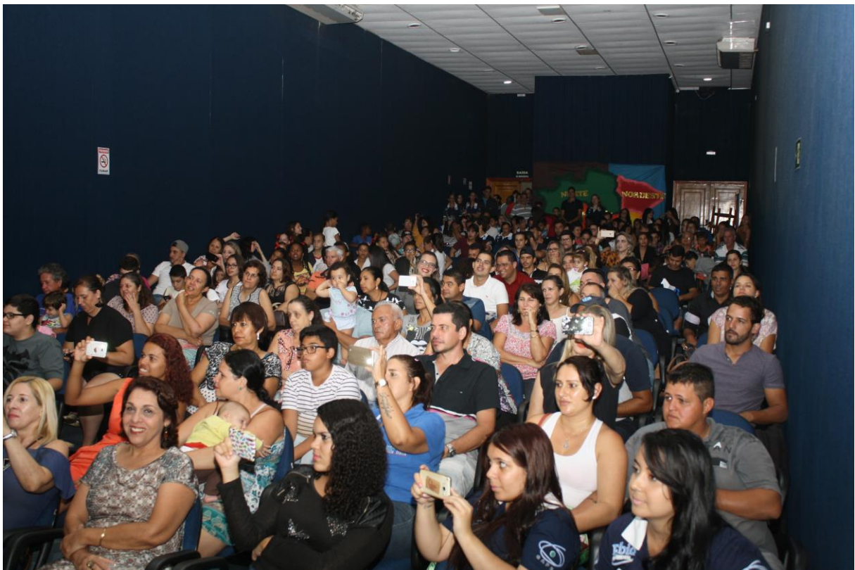
Foto 13: Apresentação dos resultados das ações desenvolvidas pelo subprojeto de Pedagogia.