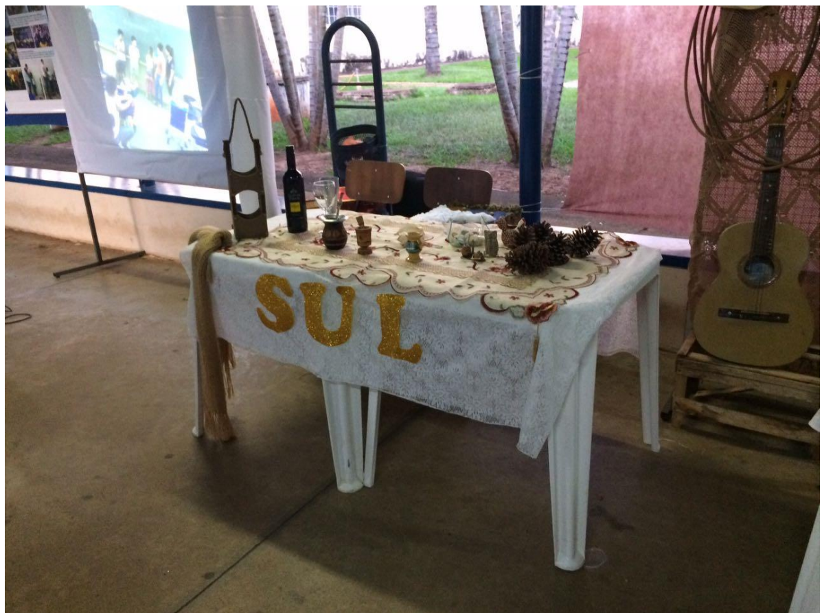
Foto 26: Apresentação dos resultados das ações desenvolvidas pelo subprojeto de Pedagogia.