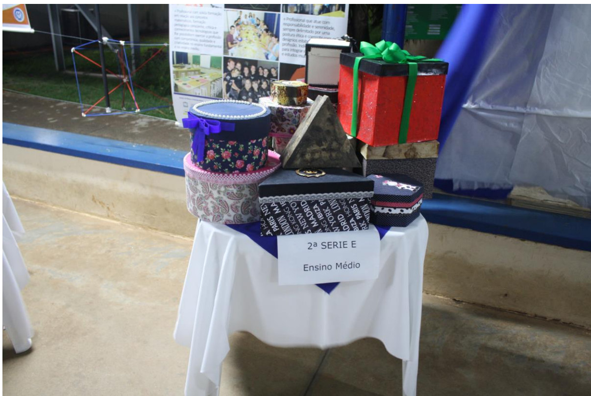
Foto 6: Apresentação dos resultados das ações desenvolvidas pelo subprojeto de Matemática.