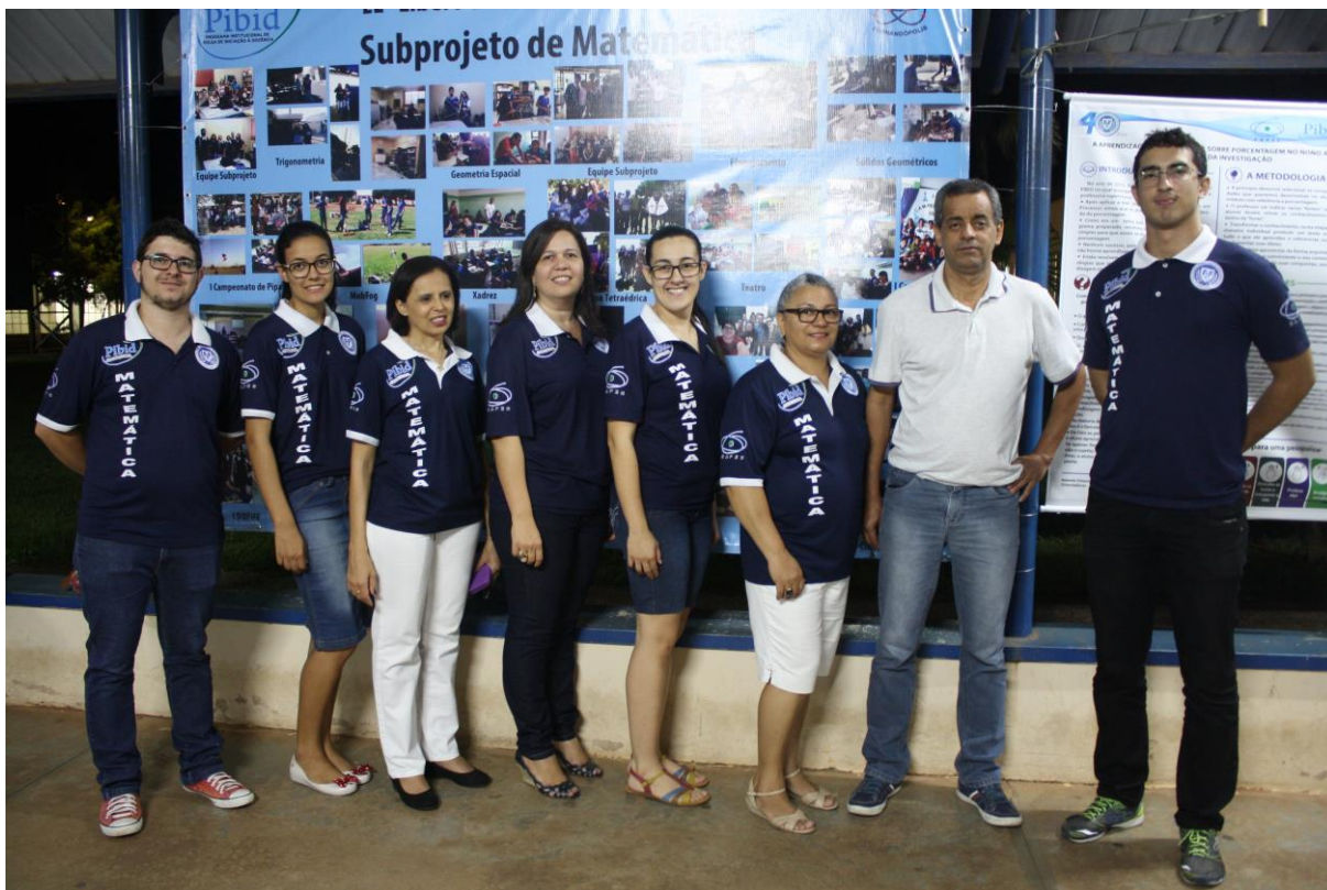
Foto 2: Apresentação dos resultados das ações desenvolvidas pelo subprojeto de Matemática.