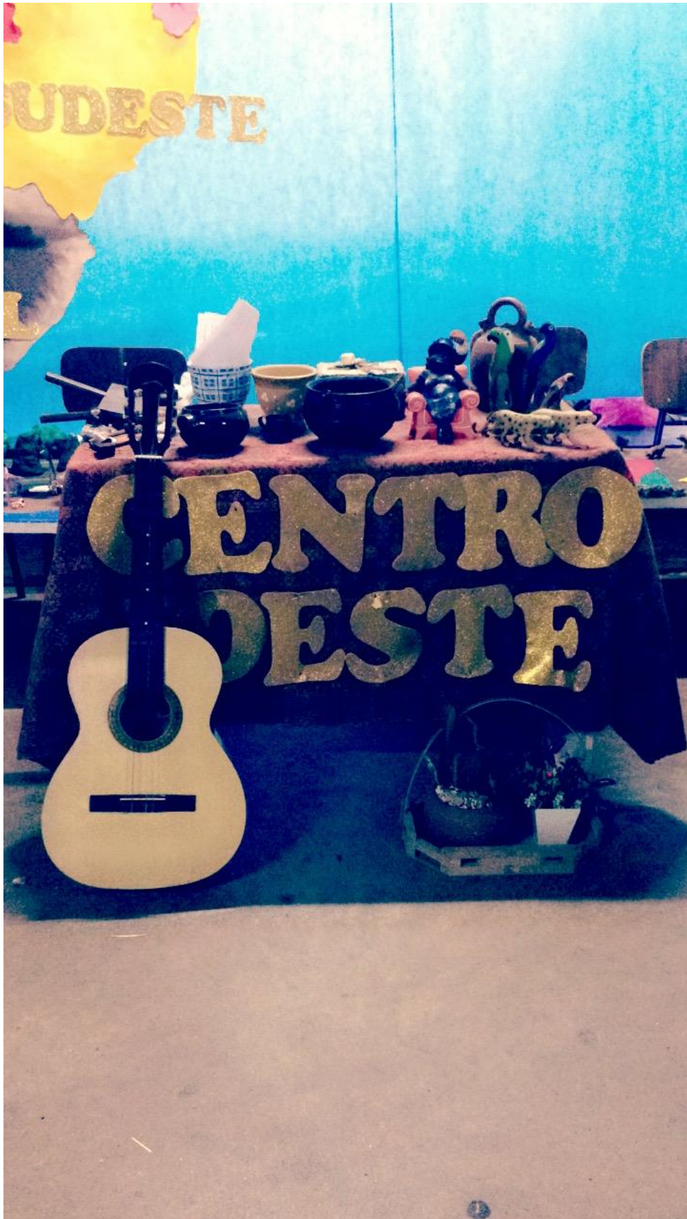
Foto 27: Apresentação dos resultados das ações desenvolvidas pelo subprojeto de Pedagogia.