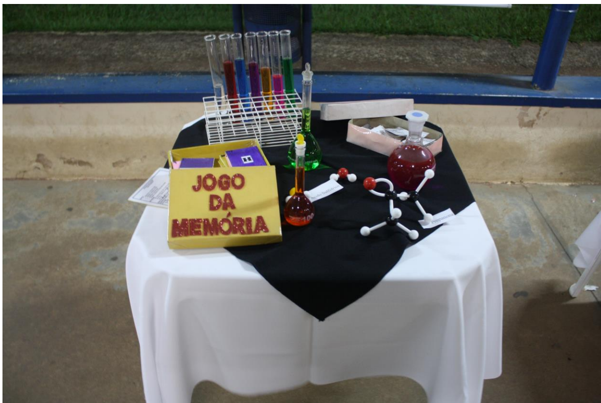
Foto 32: Apresentação dos resultados das ações desenvolvidas pelo subprojeto de Química.