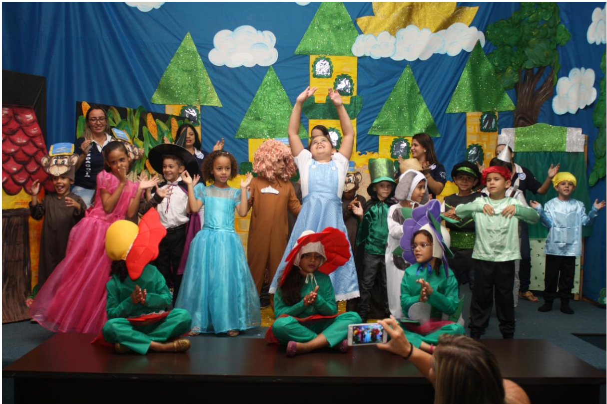
Foto 10: Apresentação dos resultados das ações desenvolvidas pelo subprojeto de Pedagogia.