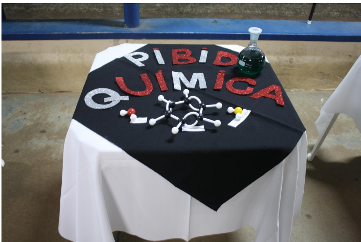
Foto 33: Apresentação dos resultados das ações desenvolvidas pelo subprojeto de Química.