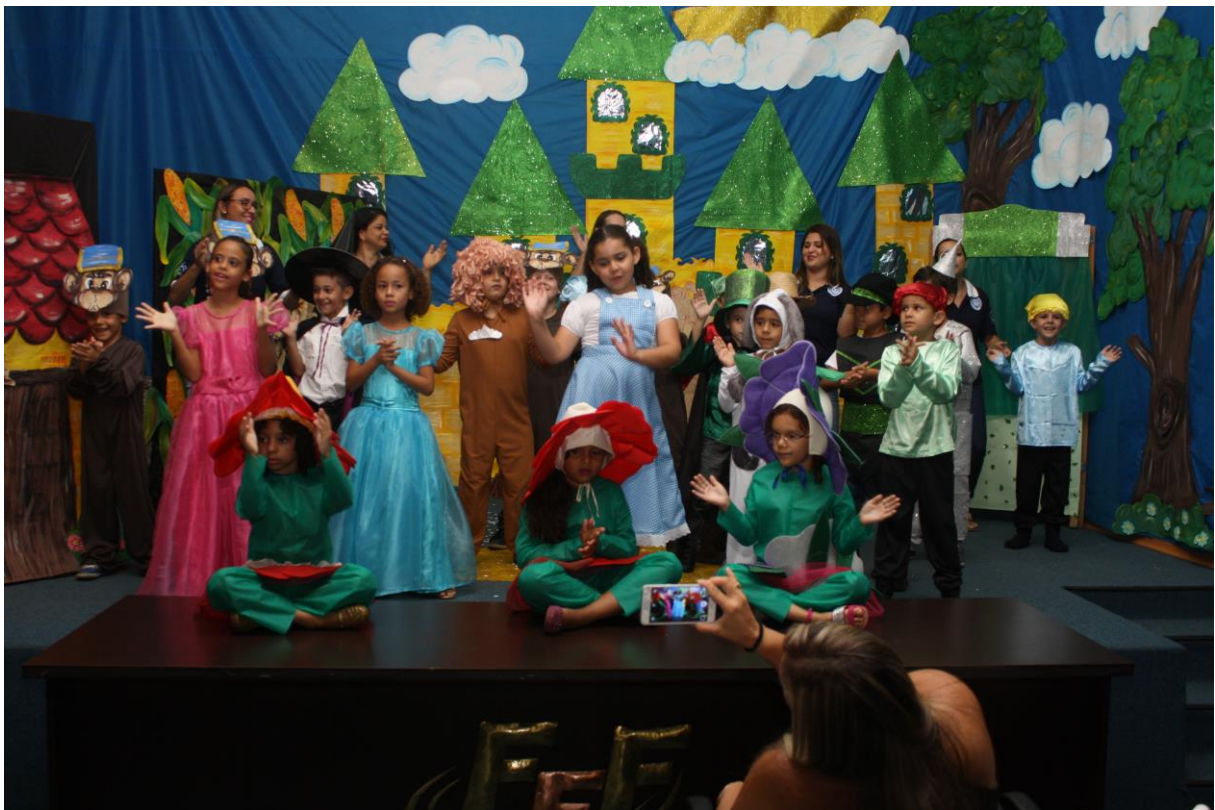
Foto 11: Apresentação dos resultados das ações desenvolvidas pelo subprojeto de Pedagogia.