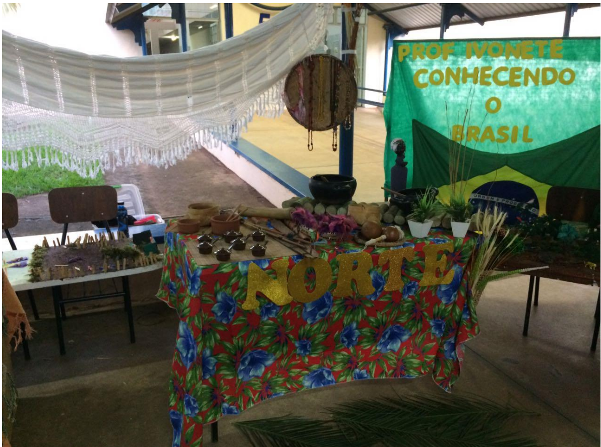
Foto 29: Apresentação dos resultados das ações desenvolvidas pelo subprojeto de Pedagogia.