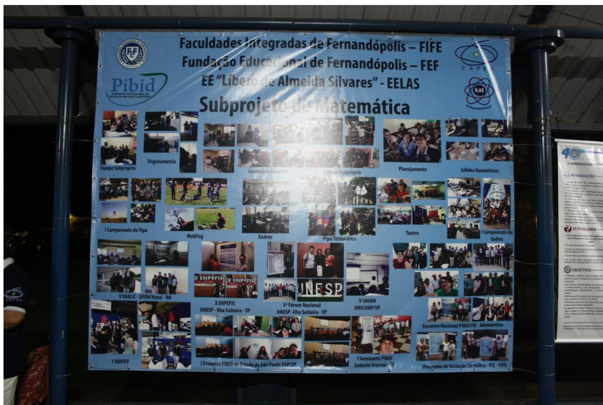
Foto 8: Apresentação dos resultados das ações desenvolvidas pelo subprojeto de Matemática.