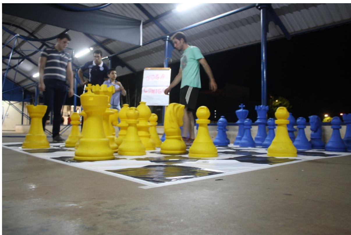
Foto 9: Apresentação dos resultados das ações desenvolvidas pelo subprojeto de Matemática.