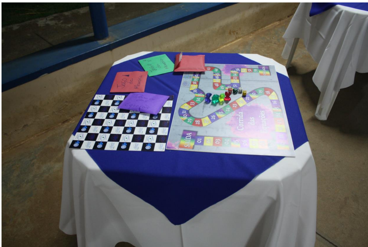
Foto 4: Apresentação dos resultados das ações desenvolvidas pelo subprojeto de Matemática.