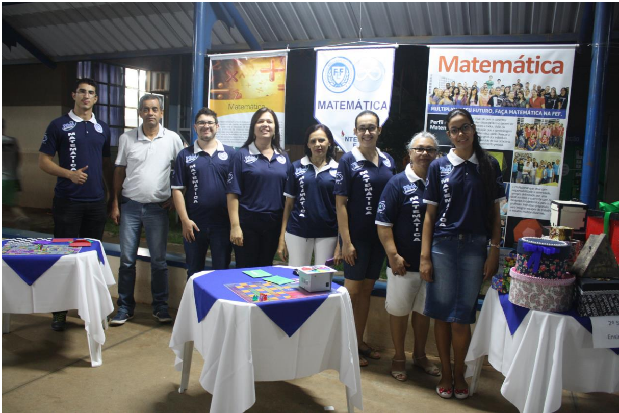
Foto 1: Apresentação dos resultados das ações desenvolvidas pelo subprojeto de Matemática.