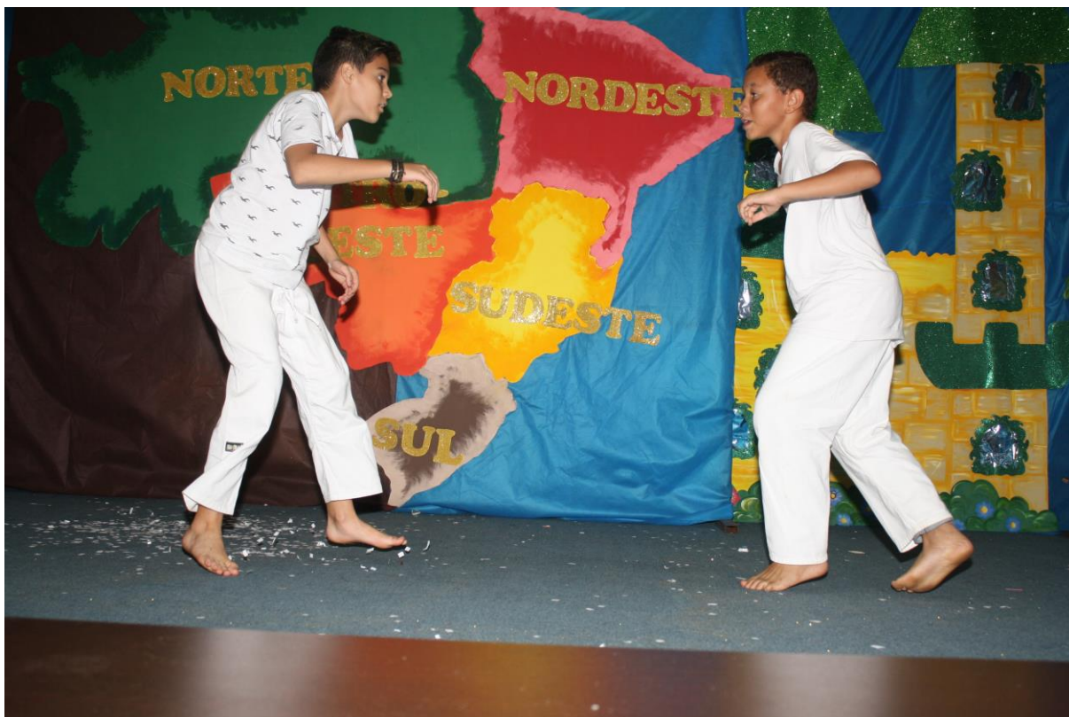
Foto 16: Apresentação dos resultados das ações desenvolvidas pelo subprojeto de Pedagogia.