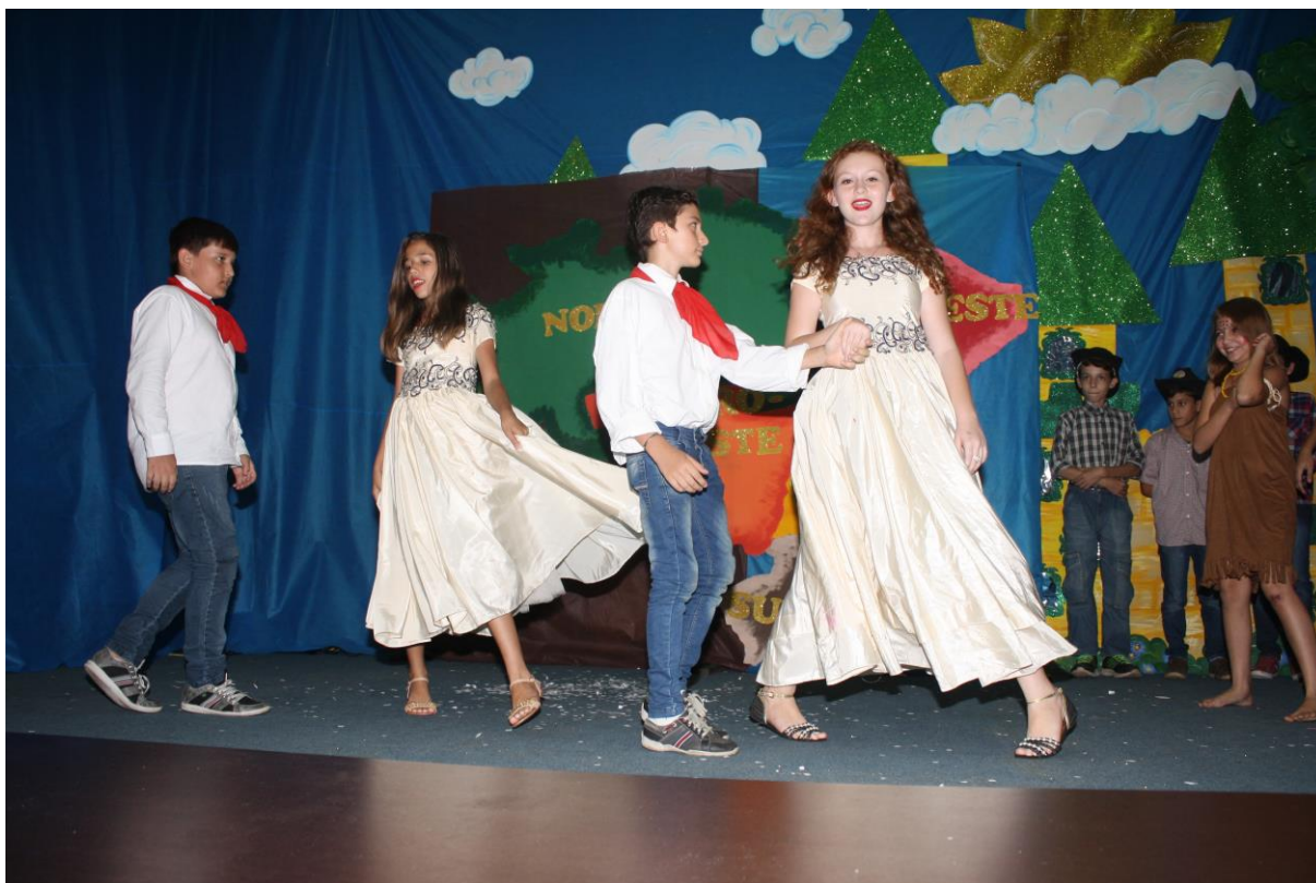
Foto 20: Apresentação dos resultados das ações desenvolvidas pelo subprojeto de Pedagogia.