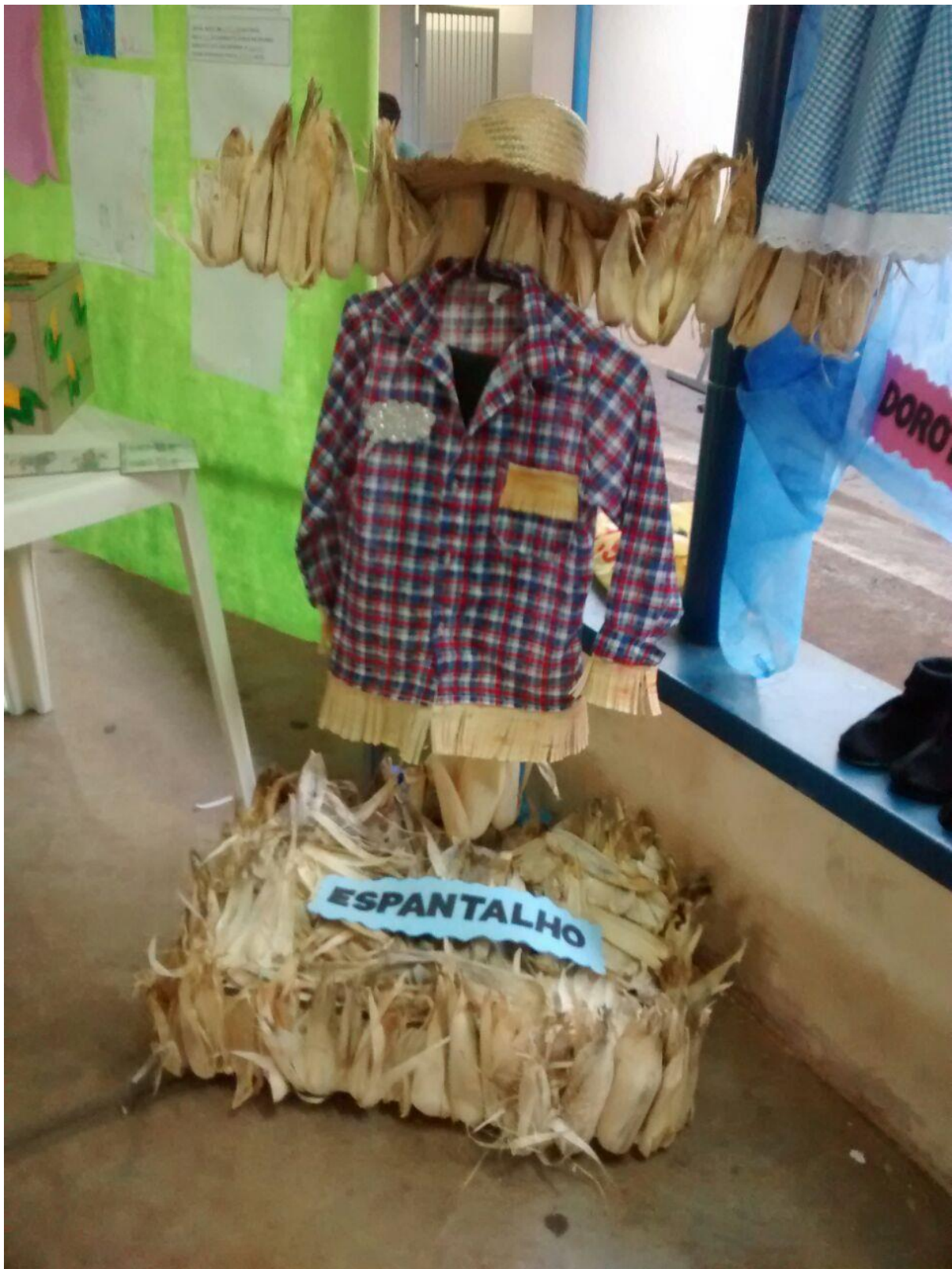
Foto 24: Apresentação dos resultados das ações desenvolvidas pelo subprojeto de Pedagogia.