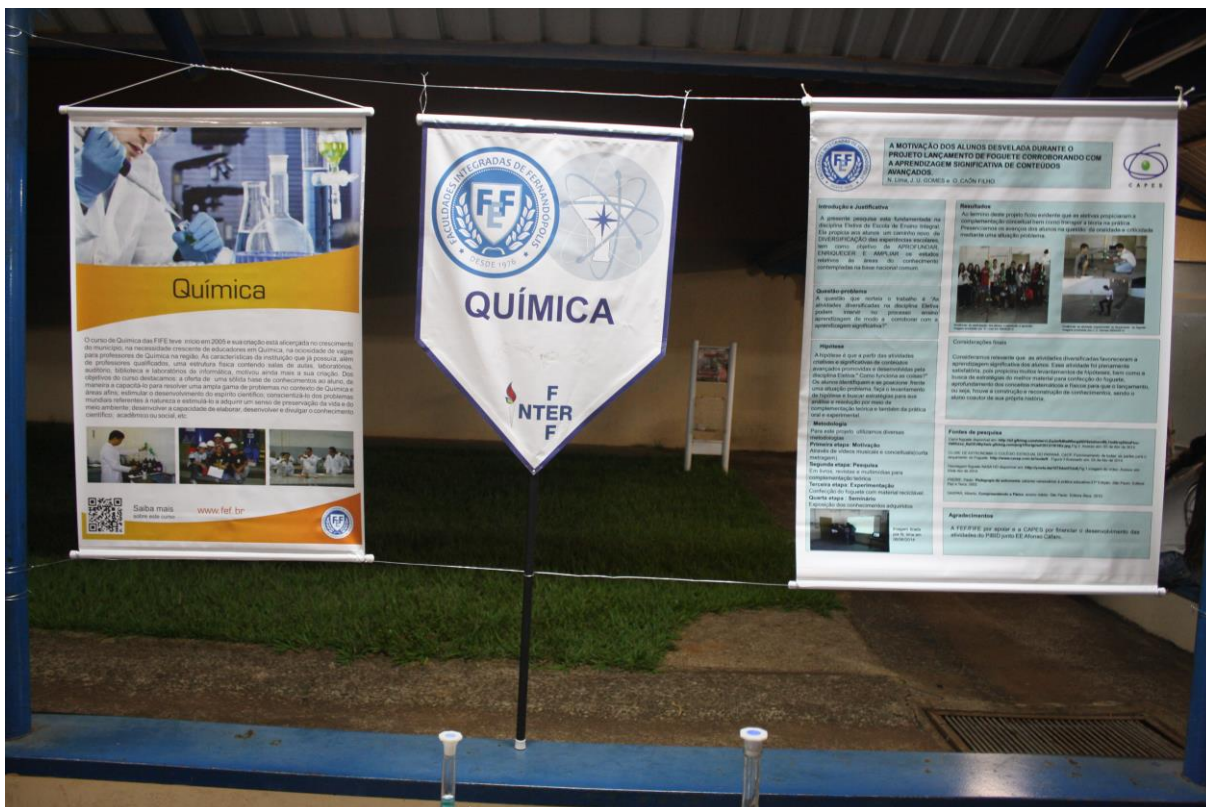
Foto 35: Apresentação dos resultados das ações desenvolvidas pelo subprojeto de Química.