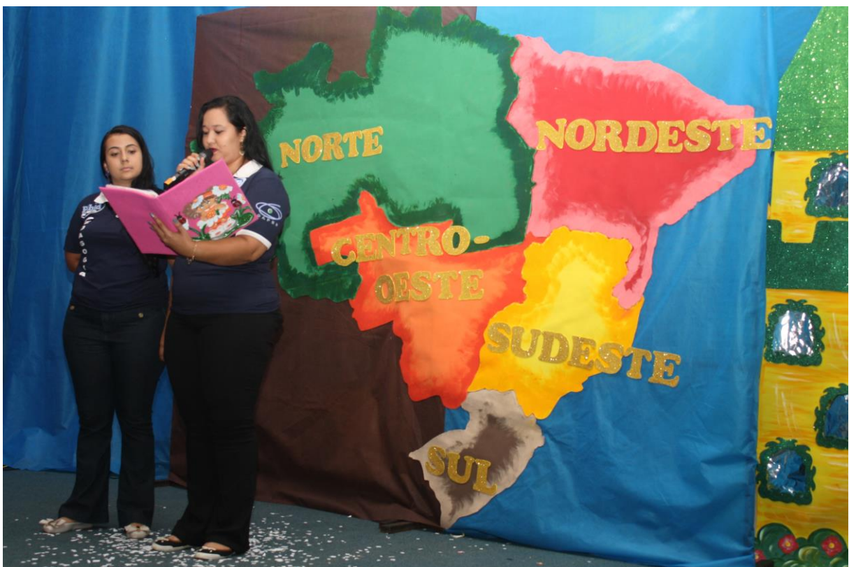
Foto 15: Apresentação dos resultados das ações desenvolvidas pelo subprojeto de Pedagogia.