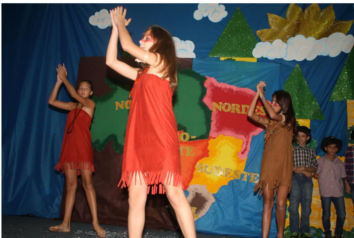
Foto 19: Apresentação dos resultados das ações desenvolvidas pelo subprojeto de Pedagogia.