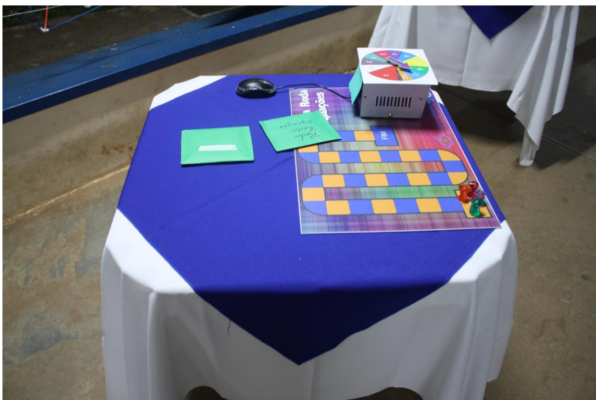
Foto 5: Apresentação dos resultados das ações desenvolvidas pelo subprojeto de Matemática.