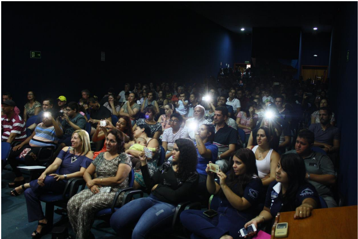
Foto 12: Apresentação dos resultados das ações desenvolvidas pelo subprojeto de Pedagogia.