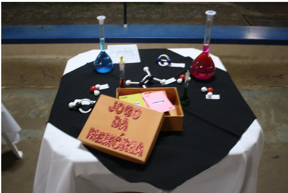
Foto 34: Apresentação dos resultados das ações desenvolvidas pelo subprojeto de Química.