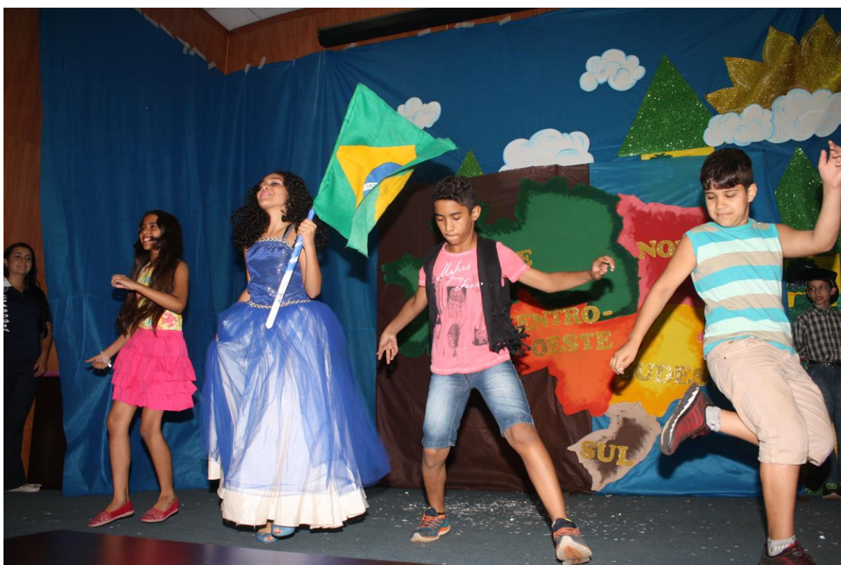
Foto 21: Apresentação dos resultados das ações desenvolvidas pelo subprojeto de Pedagogia.