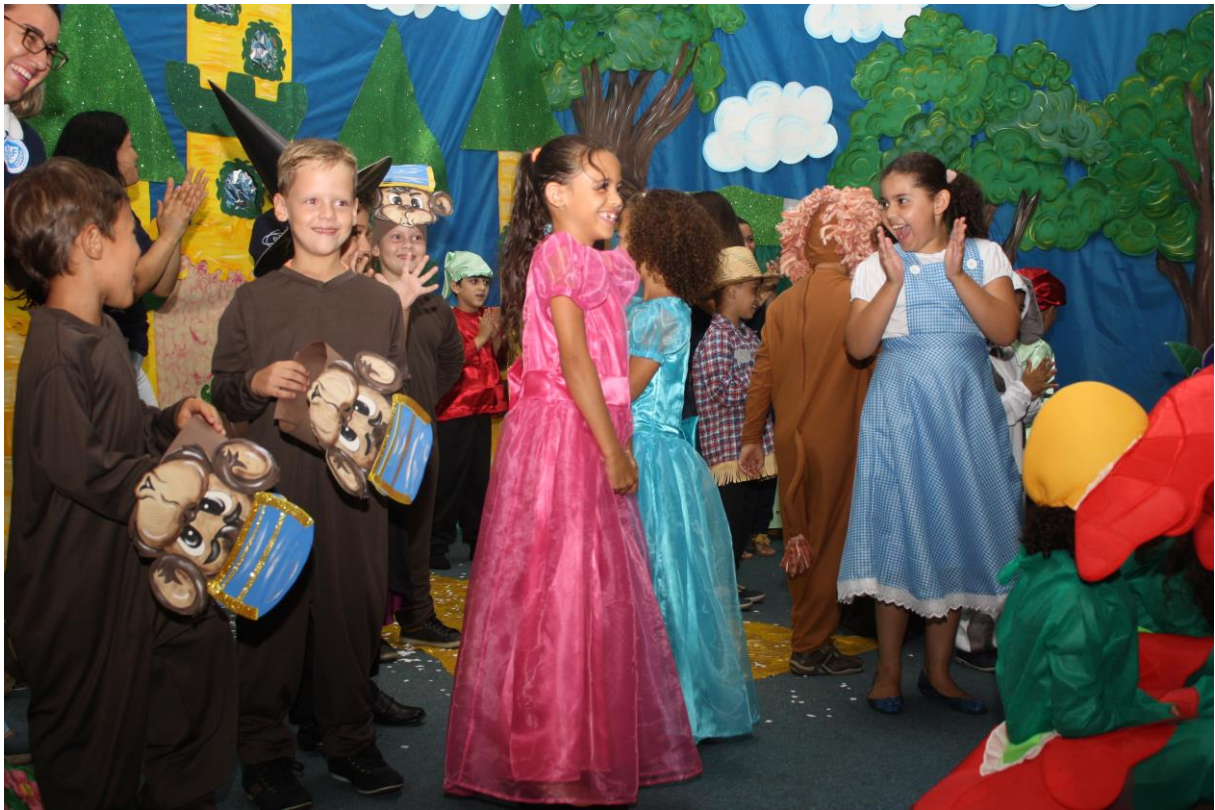
Foto 14: Apresentação dos resultados das ações desenvolvidas pelo subprojeto de Pedagogia.