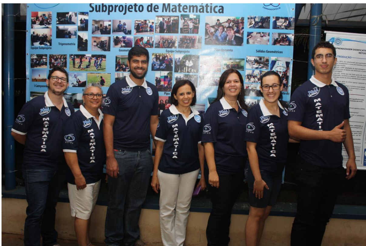
Foto 3: Apresentação dos resultados das ações desenvolvidas pelo subprojeto de Matemática.