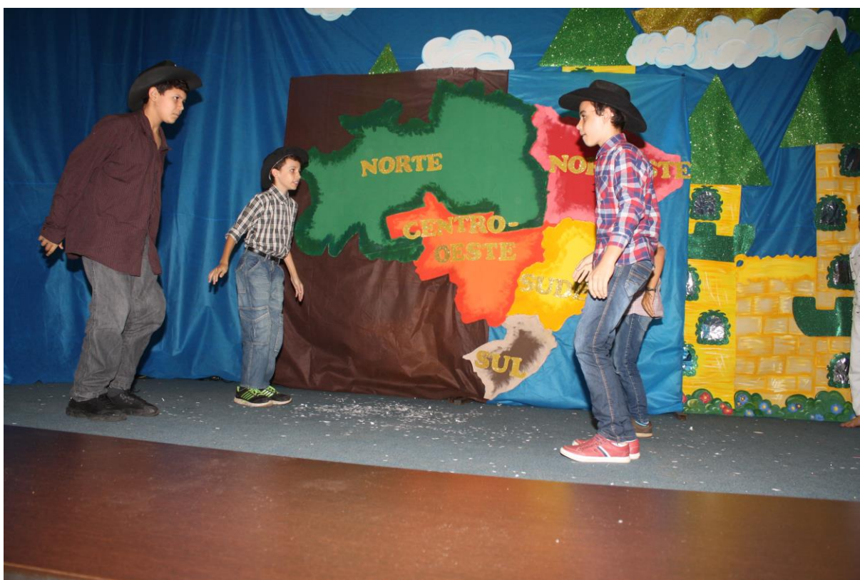
Foto 17: Apresentação dos resultados das ações desenvolvidas pelo subprojeto de Pedagogia.