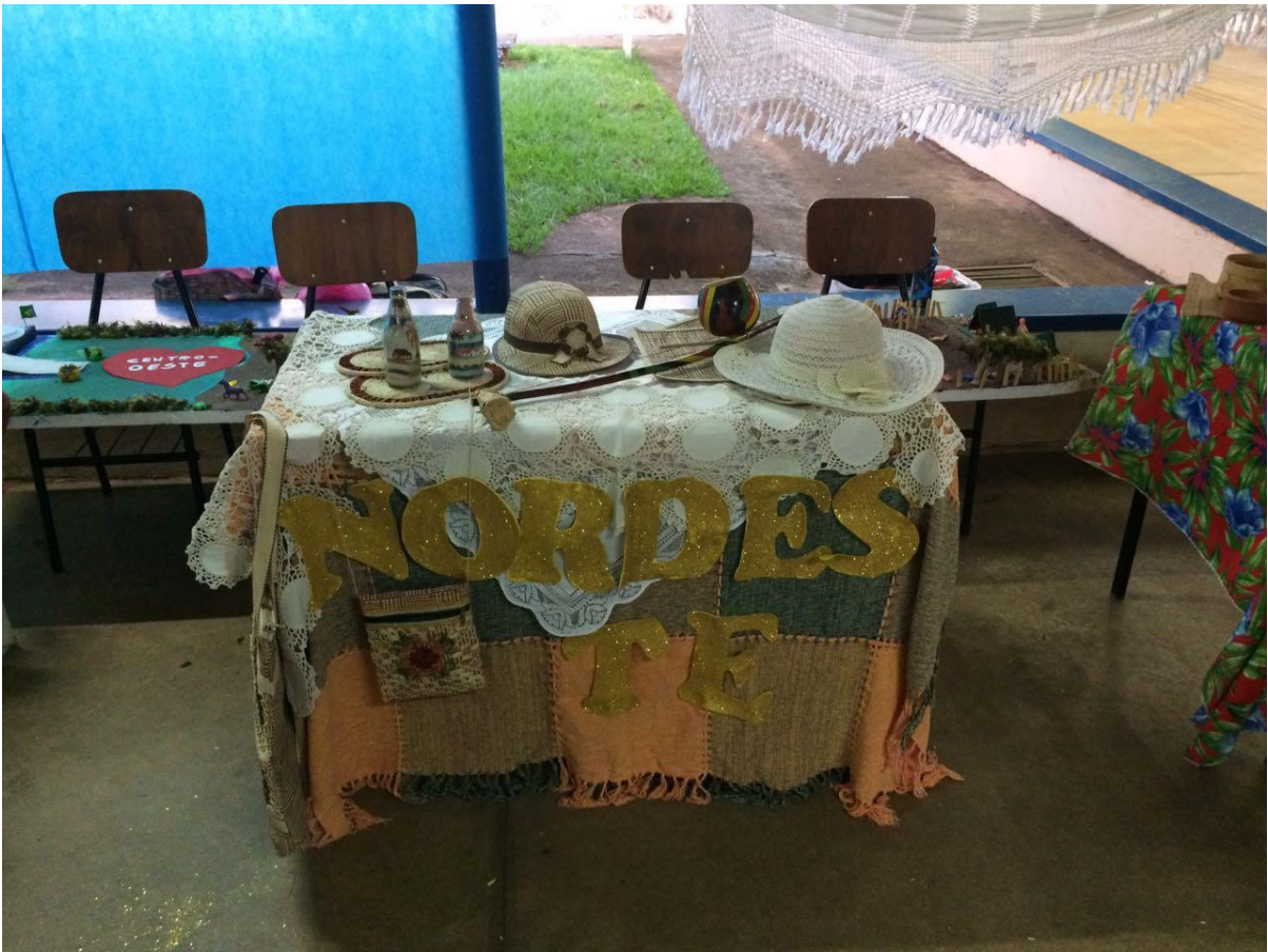
Foto 28: Apresentação dos resultados das ações desenvolvidas pelo subprojeto de Pedagogia.