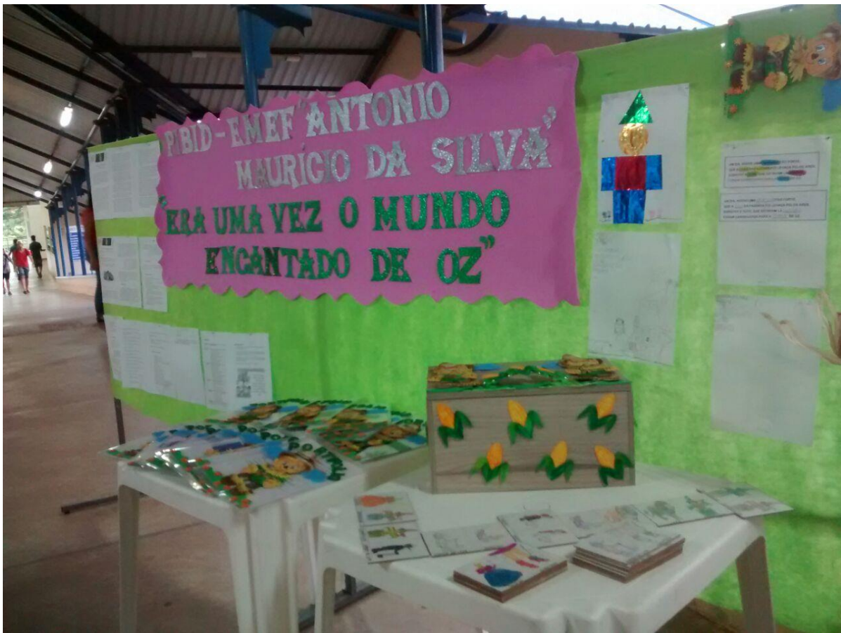
Foto 25: Apresentação dos resultados das ações desenvolvidas pelo subprojeto de Pedagogia.