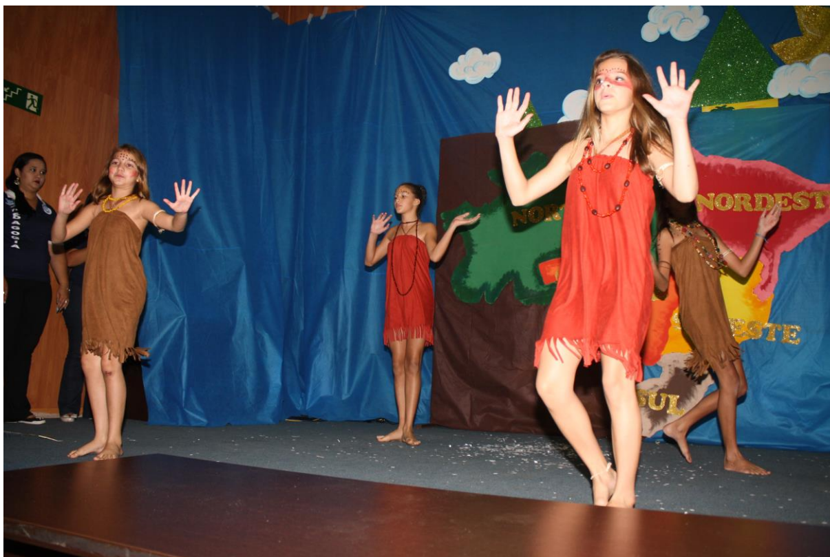
Foto 18: Apresentação dos resultados das ações desenvolvidas pelo subprojeto de Pedagogia.