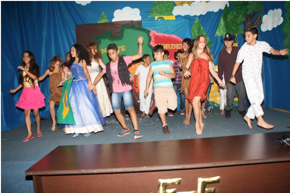
Foto 22: Apresentação dos resultados das ações desenvolvidas pelo subprojeto de Pedagogia.