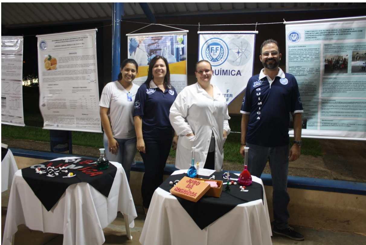
Foto 31: Apresentação dos resultados das ações desenvolvidas pelo subprojeto de Química.