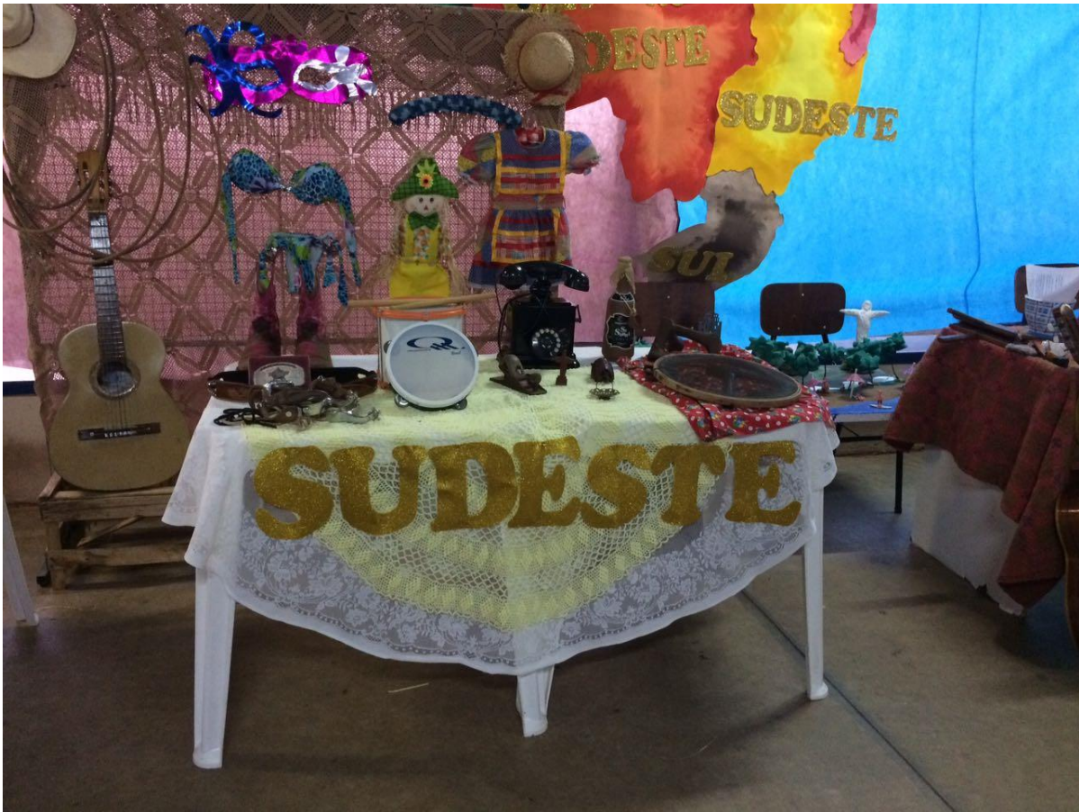
Foto 30: Apresentação dos resultados das ações desenvolvidas pelo subprojeto de Pedagogia.