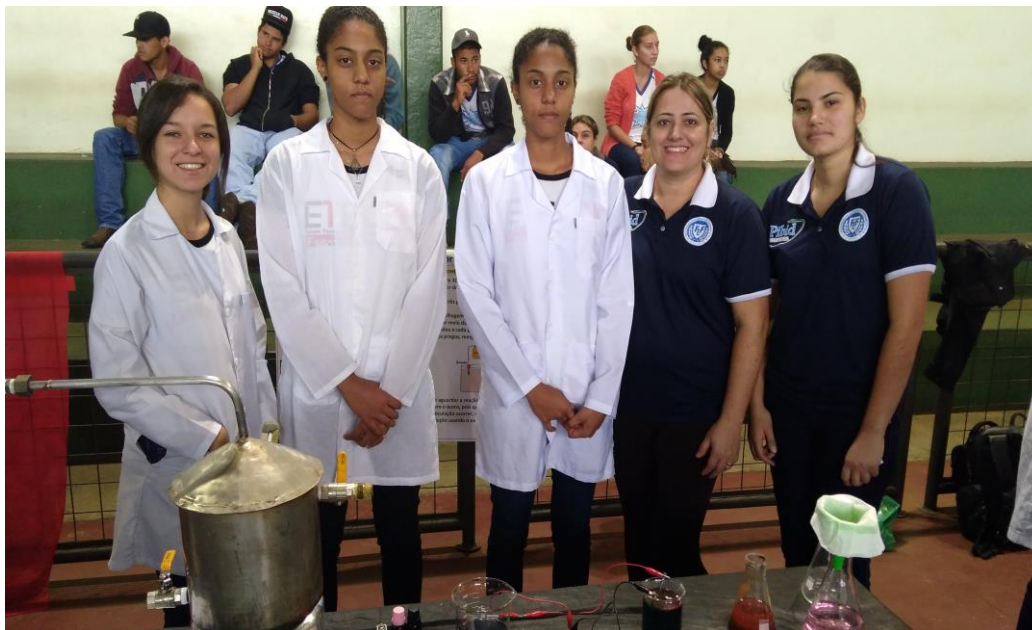
Foto 11: Exposição de experimentos de química, na Feira de Ciências e Tecnologia da ETEC de Fernandópolis – Centro Paulo Souza.