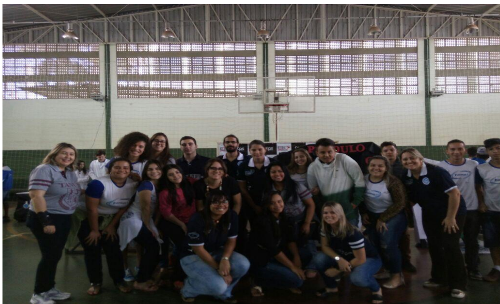
Foto 2: Visita dos alunos da 3ª série do Ensino Médio da E.E. Prof. Antônio Tanuri, dos alunos bolsistas e da professora supervisora, à Feira de Ciências e Tecnologia da ETEC de Fernandópolis – Centro Paulo Souza.