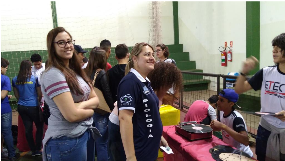
Foto 5: Presença da aluna da E.E. Prof. Antônio Tanuri e da aluna bolsista, na Feira de Ciências e Tecnologia da ETEC de Fernandópolis – Centro Paulo Souza.