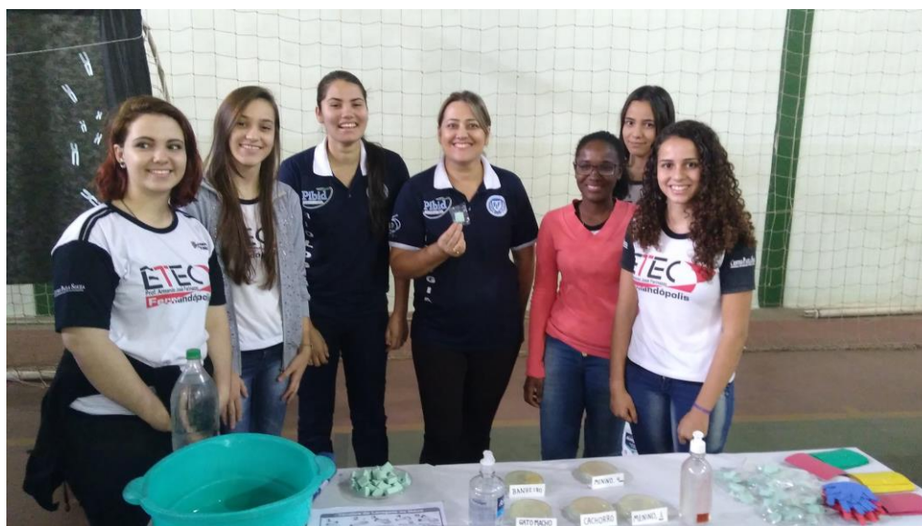
Foto 8: Exposição de experimentos, na Feira de Ciências e Tecnologia da ETEC de Fernandópolis – Centro Paulo Souza.