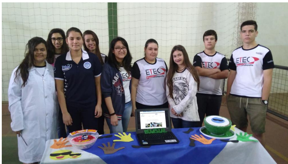
Foto 7: Exposição de maquetes de células e programas de imagem de computador Biovisual, na Feira de Ciências e Tecnologia da ETEC de Fernandópolis – Centro Paulo Souza.