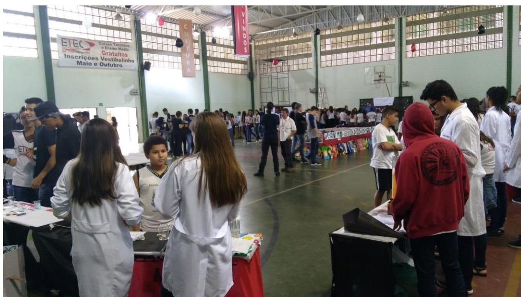
Foto 12: Exposição de quadros, na Feira de Ciências e Tecnologia da ETEC de Fernandópolis – Centro Paulo Souza.