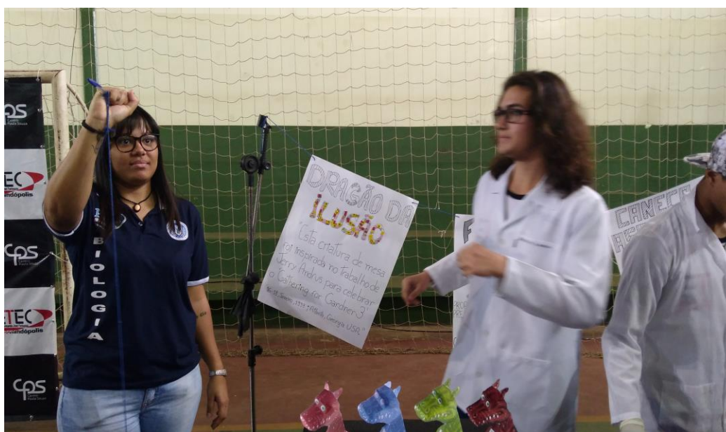
Foto 10: Exposição trabalhos de física, na Feira de Ciências e Tecnologia da ETEC de Fernandópolis – Centro Paulo Souza.