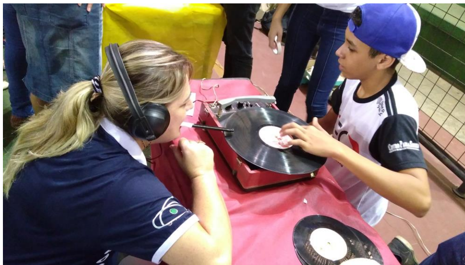
Foto 6: Exposição de trabalhos utilizando tocadores de disco de vinil, na Feira de Ciências e Tecnologia da ETEC de Fernandópolis – Centro Paulo Souza.