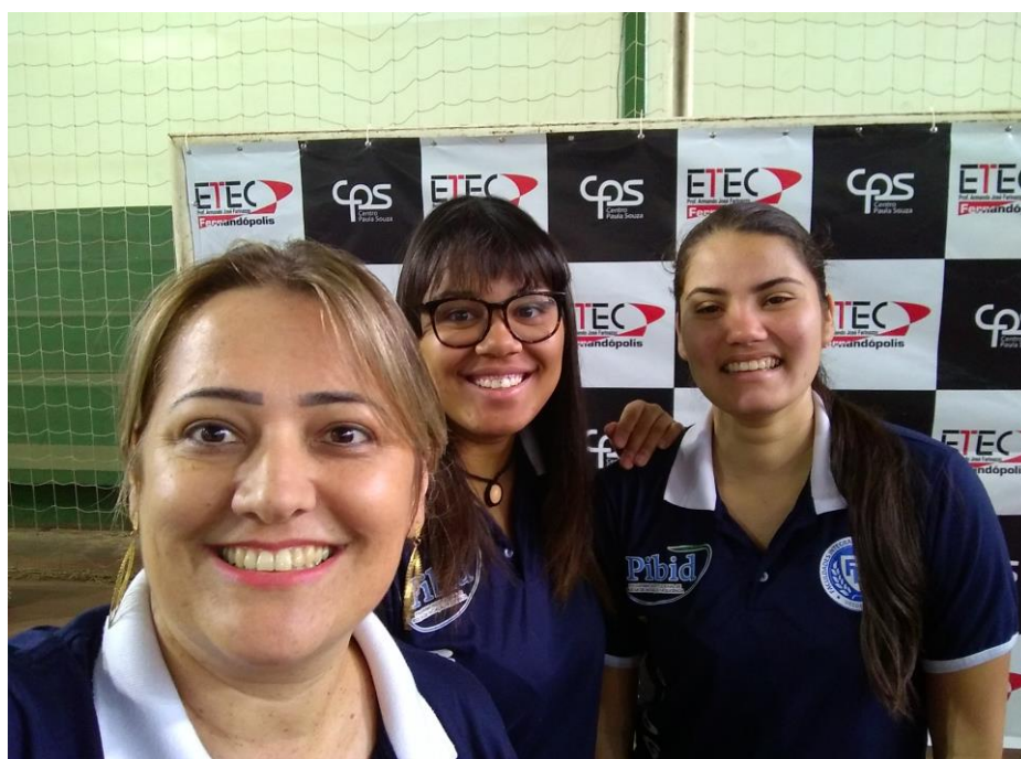
Foto 4: Presença das alunas bolsistas na Feira de Ciências e Tecnologia da ETEC de Fernandópolis – Centro Paulo Souza.