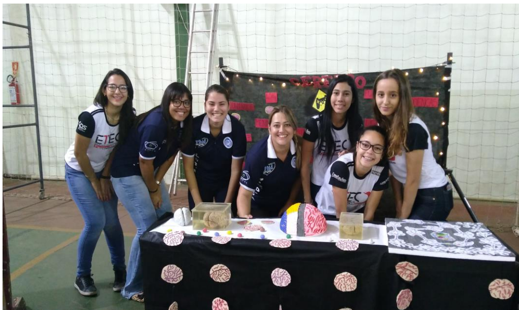
Foto 9: Exposição de trabalhos sobre o corpo humano, na Feira de Ciências e Tecnologia da ETEC de Fernandópolis – Centro Paulo Souza.