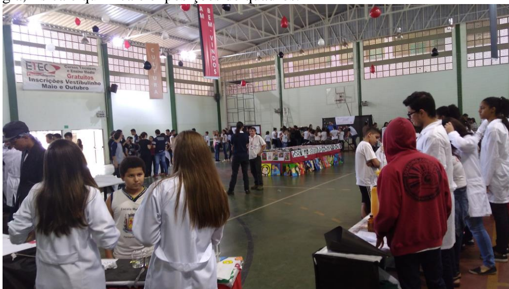
Foto 1: Feira de Ciências e Tecnologia da ETEC de Fernandópolis – Centro Paulo Souza.

Foi considerado como BANCO DE FOTOS o registro das fotos da visita dos educandos da 3ª série do Ensino Médio da E.E. Prof. Antônio Tanuri, juntamente com os alunos bolsistas e a professora supervisora, à Feira de Ciências e Tecnologia da ETEC de Fernandópolis – Centro Paulo Souza, no dia 11 de agosto de 2017. O objetivo dessa ação é promover a troca de experiências entre os alunos bolsistas, alunos educandos e alunos da ETEC, proporcionando a aquisição de conhecimento, diante dos trabalhos criativos e inovadores apresentados no evento como maquetes de células; programas de imagem de computador Biovisual; trabalhos sobre o corpo humano; experimentos de biologia, física e química e exposições de quadros.