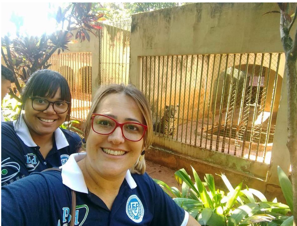
Foto 6: Alunas bolsistas visitando o Zoológico Municipal de São José do Rio Preto – SP.