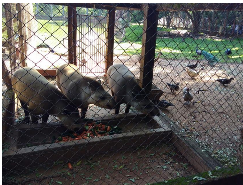
Foto 11: Anta do Zoológico Municipal de São José do Rio Preto – SP.