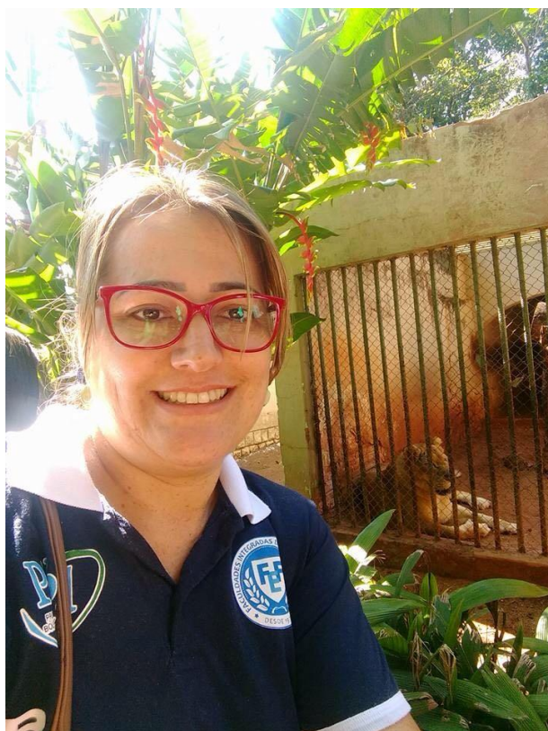
Foto 4: Aluna bolsista visitando o Zoológico Municipal de São José do Rio Preto – SP.