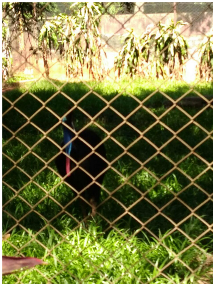
Foto 10: Ave do Zoológico Municipal de São José do Rio Preto – SP.