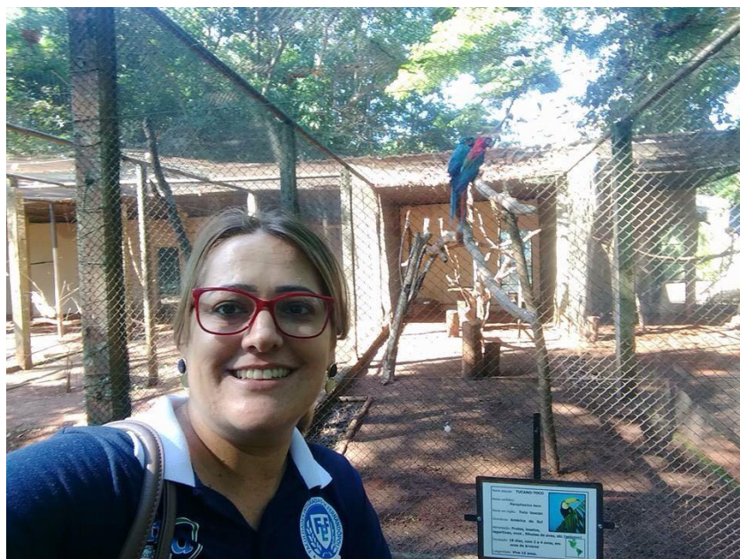
Foto 5: Aluna bolsista visitando o Zoológico Municipal de São José do Rio Preto – SP.