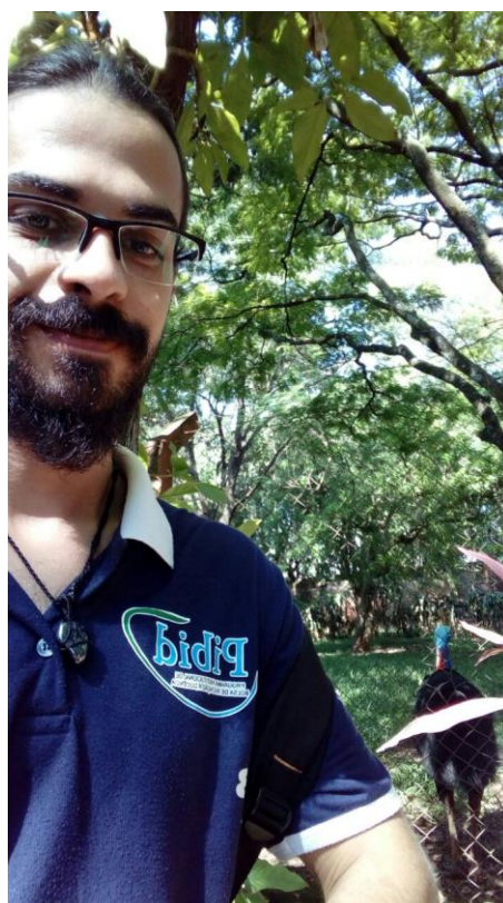
Foto 7: Aluno bolsista visitando o Zoológico Municipal de São José do Rio Preto – SP.