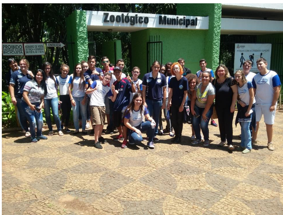
Foto 1: Visita técnica ao Zoológico Municipal de São José do Rio Preto – SP, pelos alunos educandos, bolsistas e professora supervisora, no dia 29 de novembro de 2017.

A visita ao zoológico é uma atividade educativa e produtiva, que aguça a imaginação dos alunos, permitindo que eles conheçam espécies que não são encontradas em seu dia a dia, e também a diversidade da fauna e da flora brasileira. É uma metodologia de ensino que, além de acabar com a monotonia da sala de aula, possibilita que o aluno faça suas próprias observações, perceba detalhes e aprenda a ter um carinho maior pelos animais, além de ser uma atividade prazerosa e interessante.