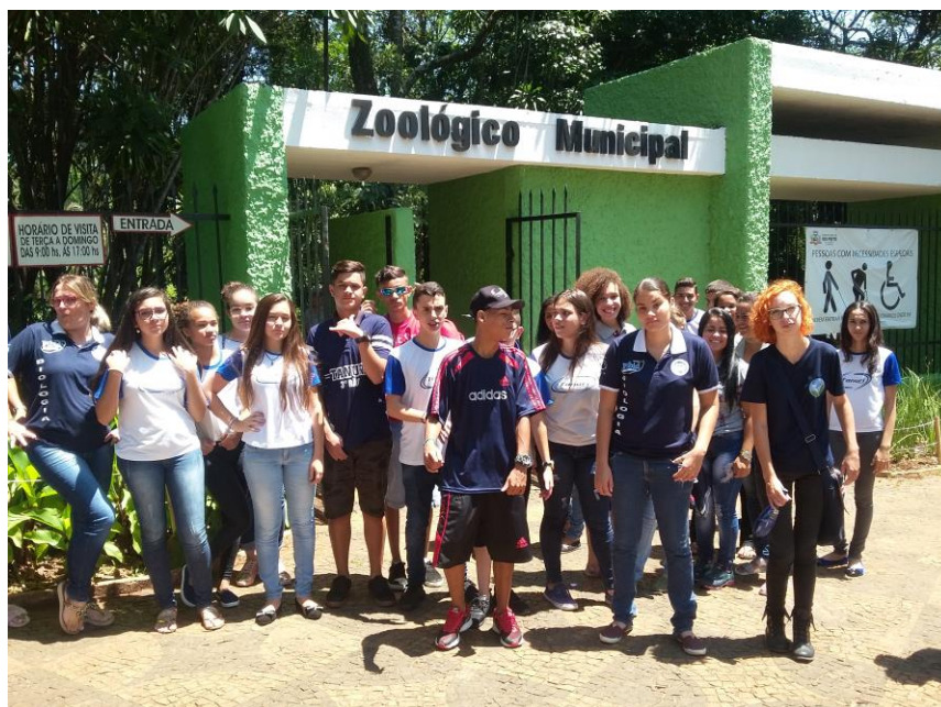
Foto 2: Alunos educandos e bolsistas visitando o Zoológico Municipal de São José do Rio Preto – SP.