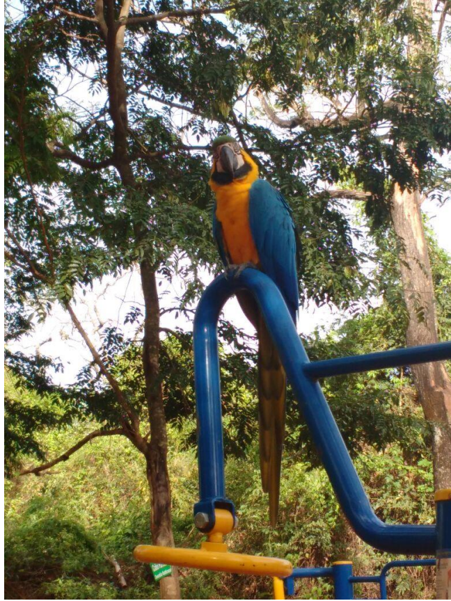
Foto 8: Arara azul do peito amarelo, do Zoológico Municipal de São José do Rio Preto – SP.