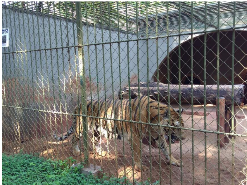
Foto 9: Tigre do Zoológico Municipal de São José do Rio Preto – SP.