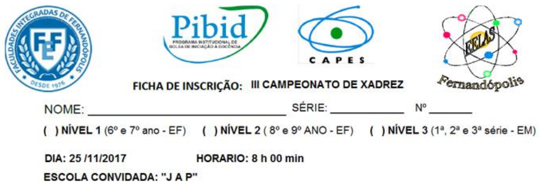
Foto 04: Ficha de Inscrição para a Escola Estadual Joaquim Antônio Pereira – JAP