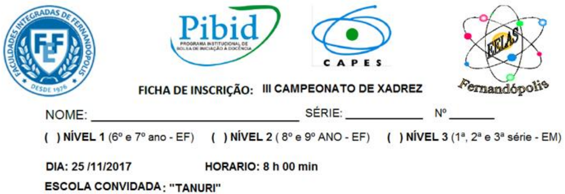
Foto 10: Ficha de Inscrição para a Escola Estadual Professor Antônio Tanuri