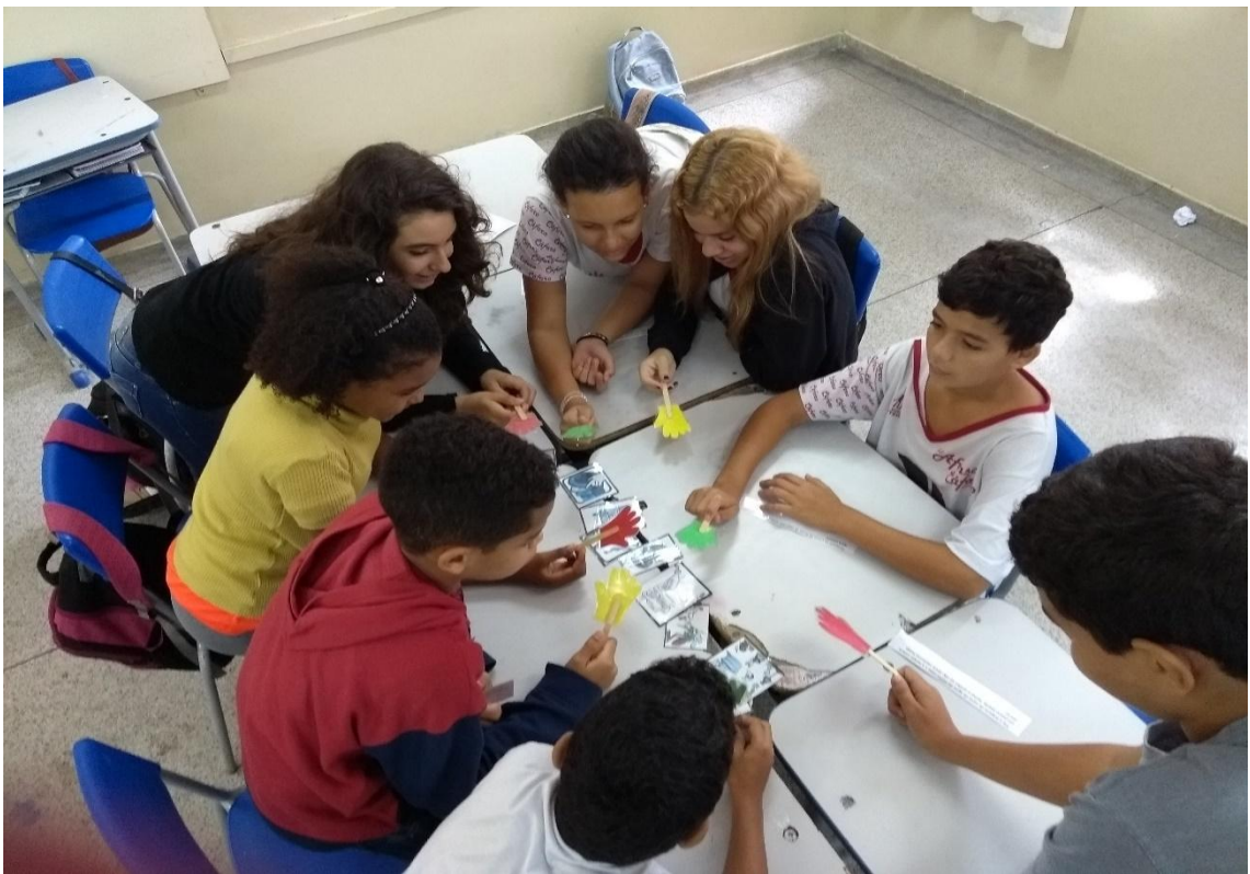
Figura 5. Alunos participando do jogo.