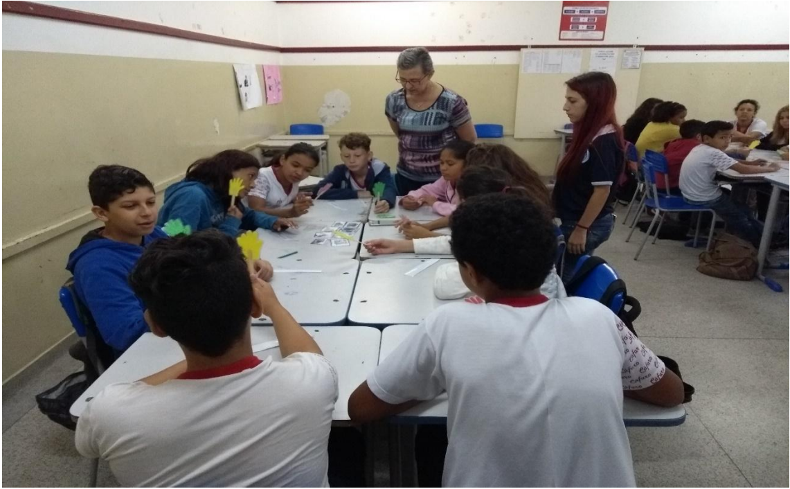
Figura 4. Alunos participando do jogo.