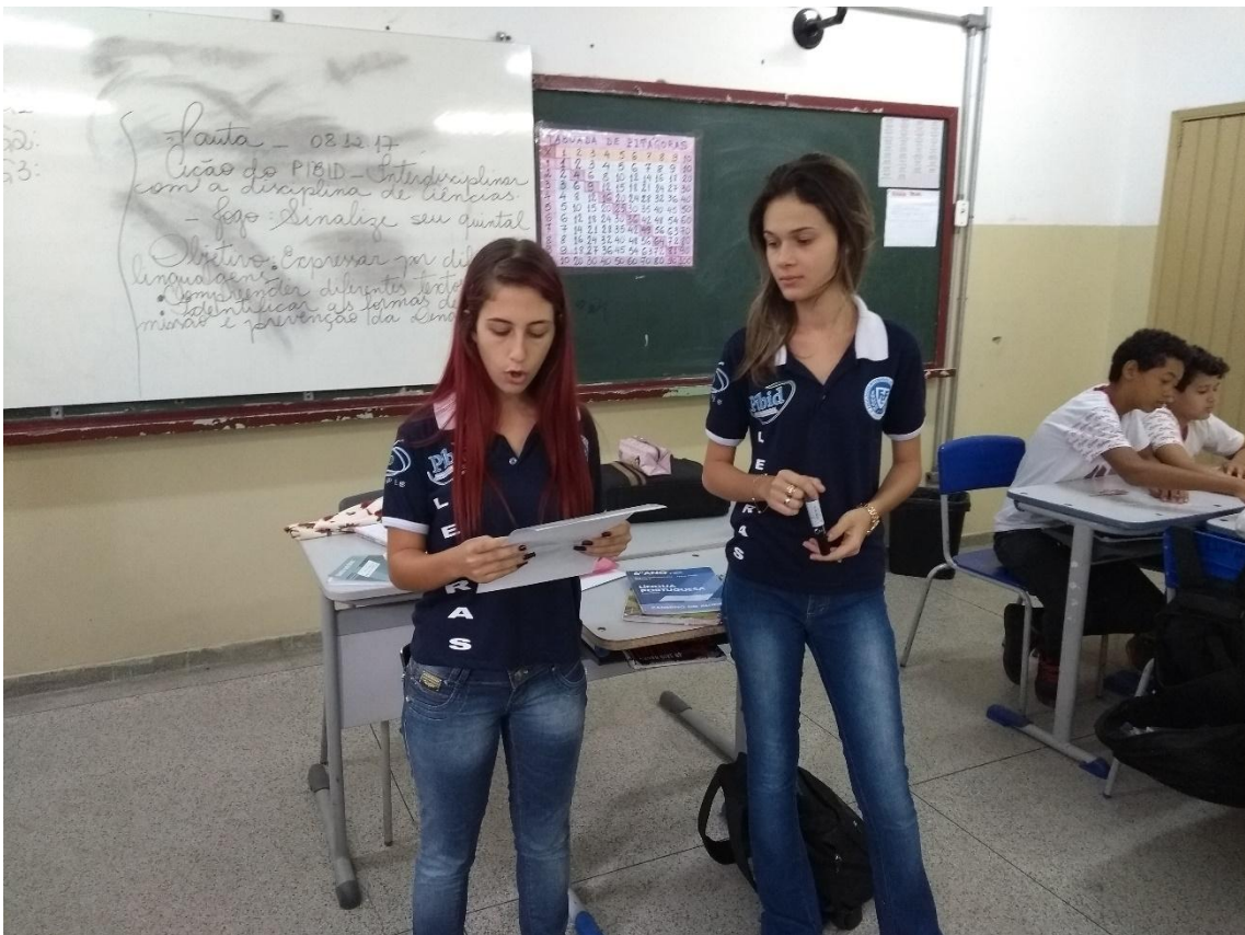
Figura 3. Alunas estagiárias orientando os alunos na atividade.