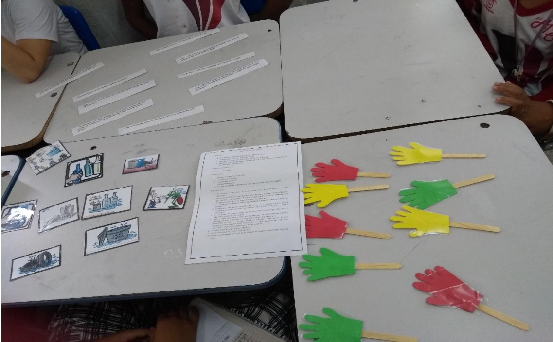
Figura 2. O Jogo