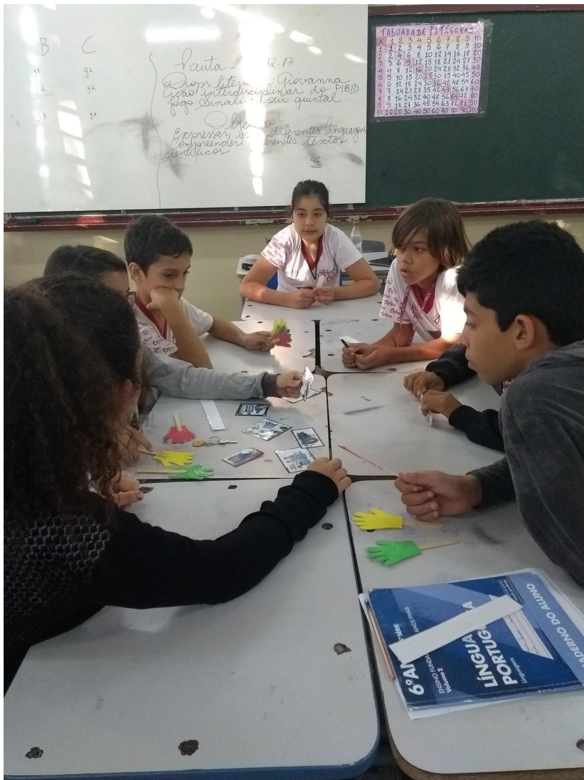
Figura 6 . Alunos participando do jogo.