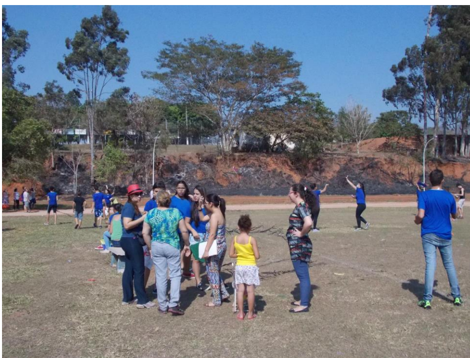
Foto 04: Professora Supervisora de educação Física, BID e Coordenadora da Área de Matemática, alunos da EELAS