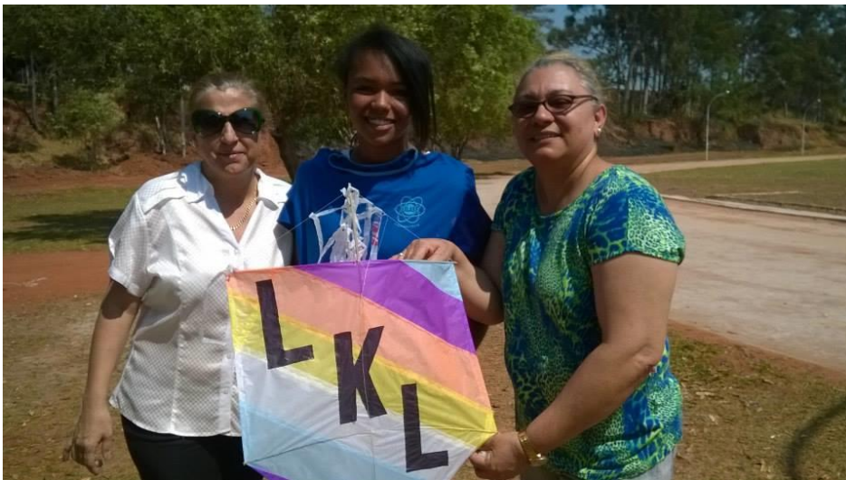
Foto 02: Professora Coordenadora da EELAS, aluna do 1º ano do EM e Professora Coordenadora da Área de Matemática