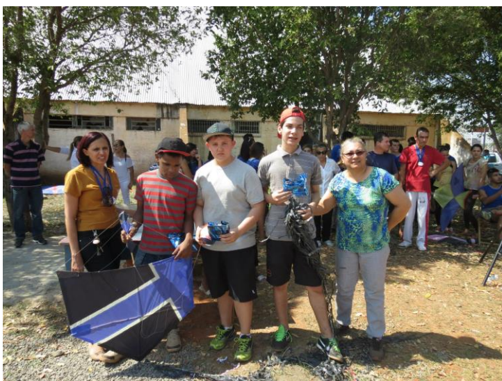
Foto23: professora Supervisora de Matemática, Alunos medalha e Professora Coordenadora de Área de Matemática