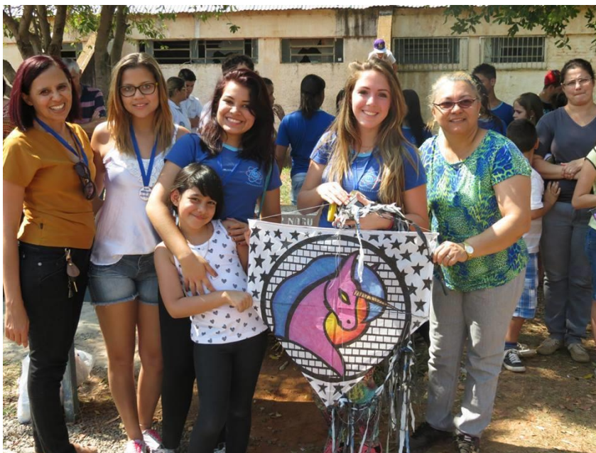
Foto 22: Professora Supervisora de Matemática, Alunas medalha de Ouro na modalidade Melhor decoração (desenho mosaico feito a mão) e Professora Coordenadora de Área de Matemática