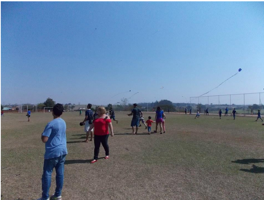
Foto 15: Alunos da EELAS e familiares, Professora de Língua Portuguesa da EELAS (blusa vermelha)