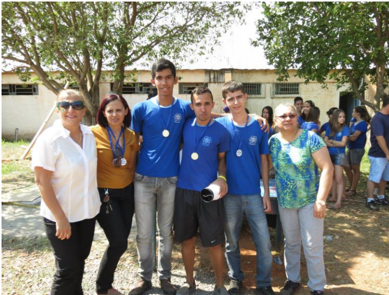
Foto 25: Professora Coordenadora da EELAS, Professora Supervisora de Matemática, Alunos medalha e Alunos medalha e professora Coordenadora de Área de Matemática