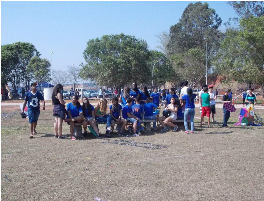
Foto 20: Alunos da EELAS aguardando a categoria para soltar a pipa