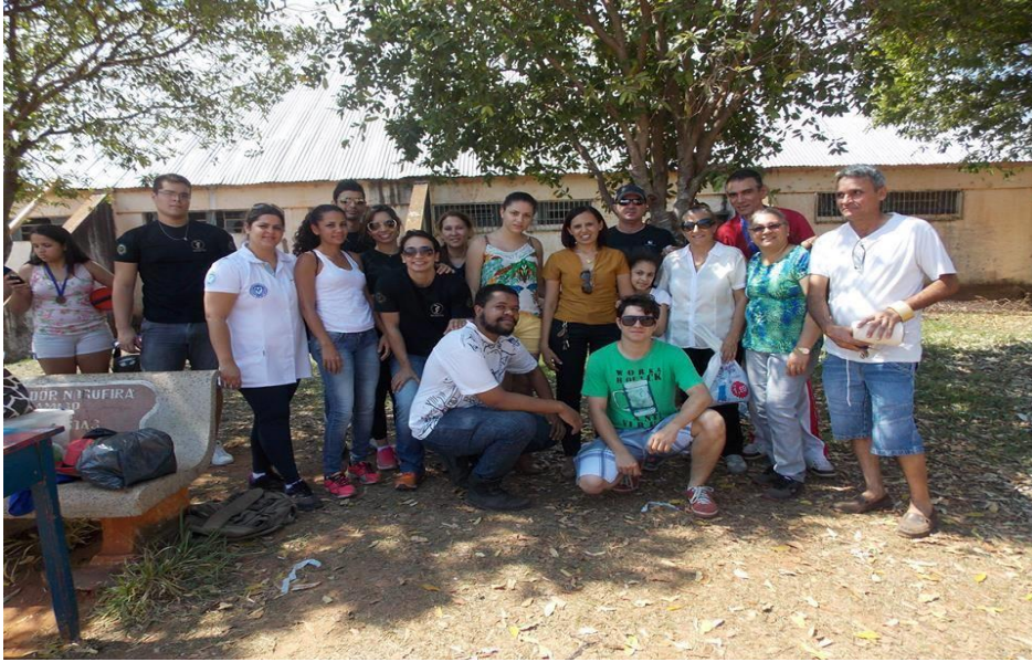
Foto01: Bids, gestores da EELAS, Professor Supervisor, Professor Colaborador e Coordenador de Área de Matemática e de Educação Física