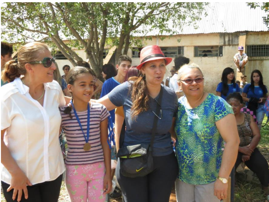
Foto 21: Professora Coordenadora da EELAS, Aluna da EELAS, Professora Supervisora de Educação física e Professora Coordenadora de Área de Matemática