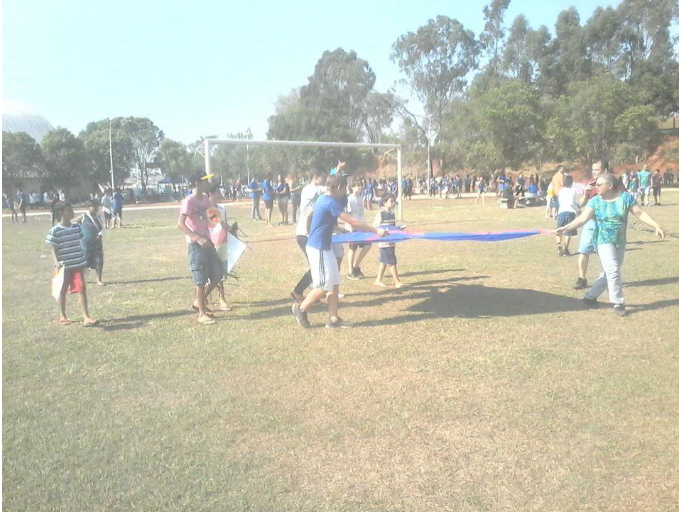
Foto 12: Alunos da EELAS, familiares, Professora Coordenadora de Área de Matemática e Diretor da EELAS se preparando para empinar a maior pipa