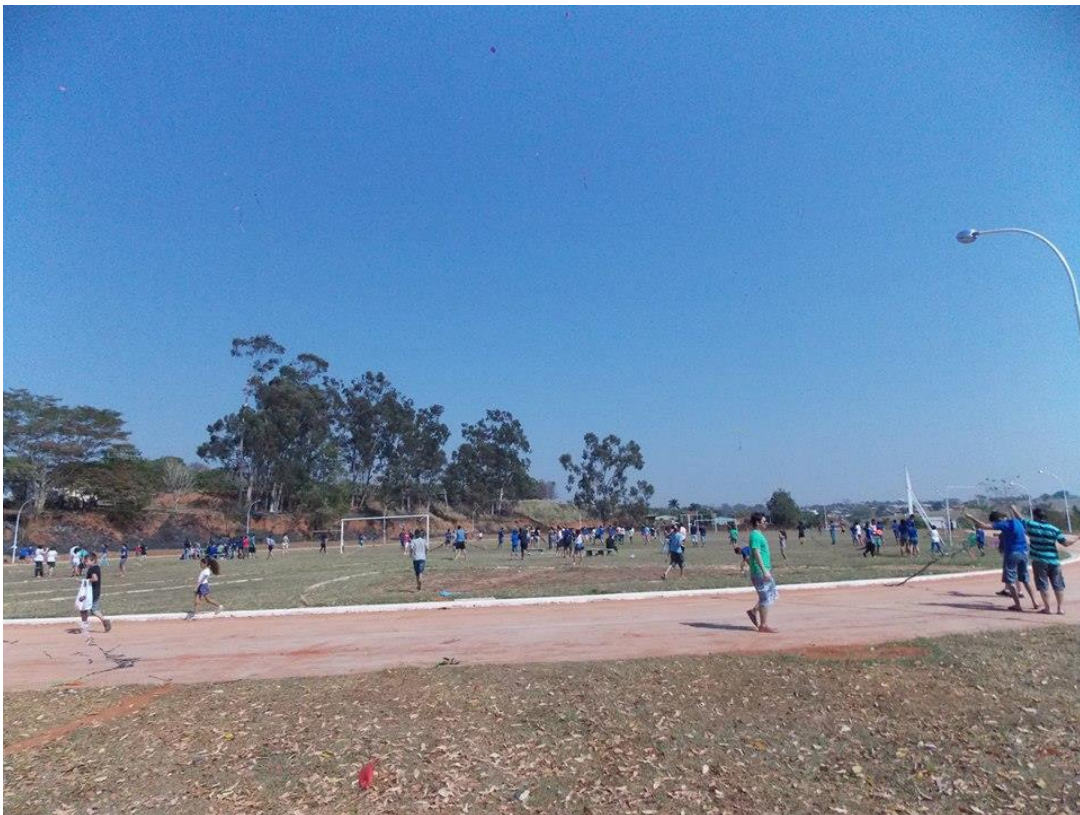
Foto17: Alunos da EELAS e familiares no Campeonato de pipa