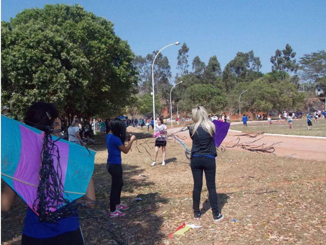
Foto16: Alunas da EELAS se preparando para empinar pipa