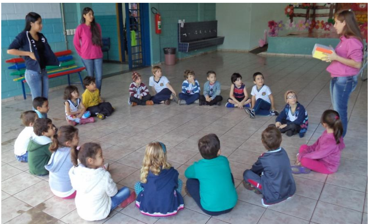
Atividade: óculos coloridos