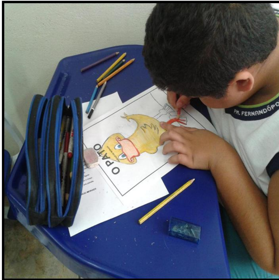
Ilustrando os poemas