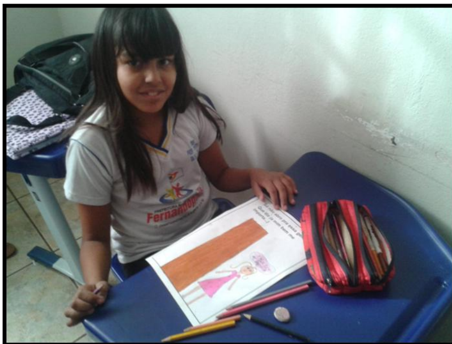
POEMA – A FOCA VINICIUS DE MORAES – momento de escrita