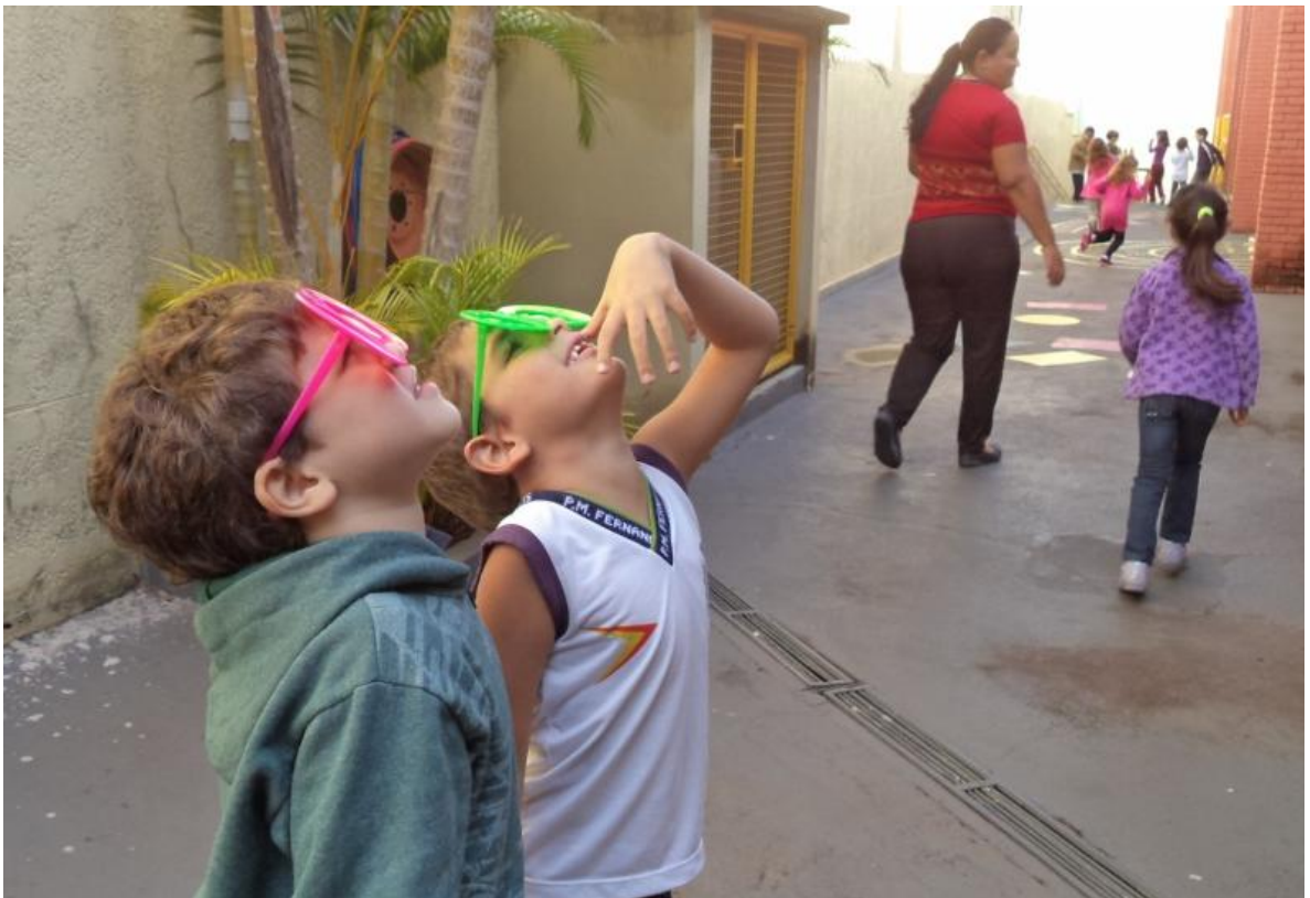
Brincadeira: cabra - cega