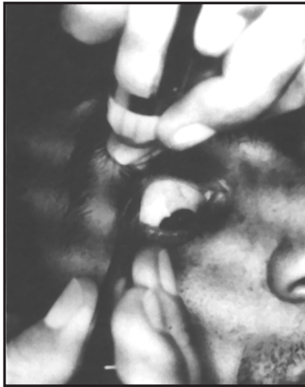
RETIRADA DE CÍLIOS ▼