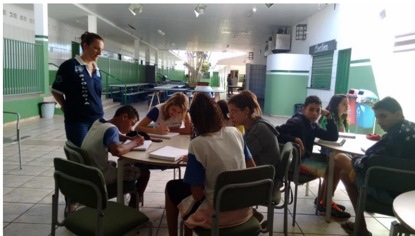
Foto 7: Síntese da análise da visualização realizada, através da resposta do questionário, pelos alunos da 1ª série do Ensino Médio, sob a orientação do bolsista.