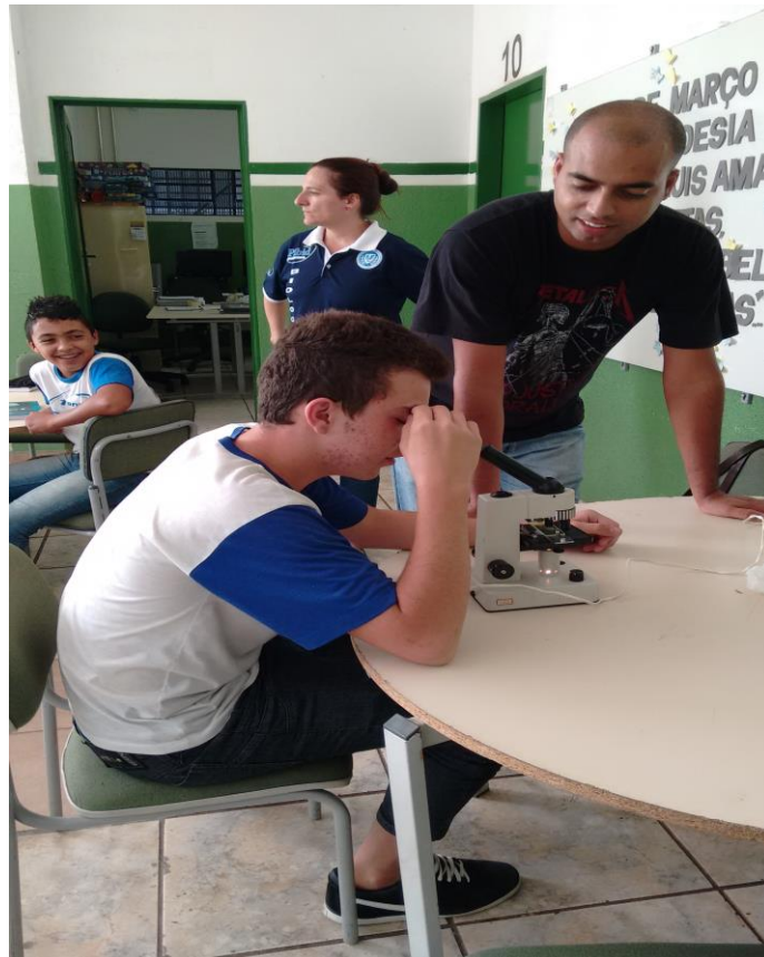
Foto 2: Observação do material a ser analisado pelo educando, sob a orientação do bolsista.