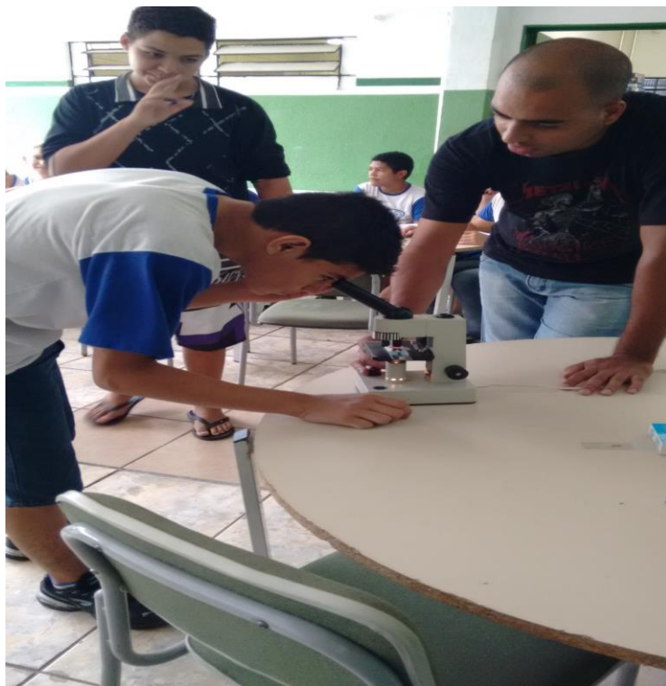
Foto 4: Observação do material a ser analisado pelo educando, sob a orientação do bolsista.