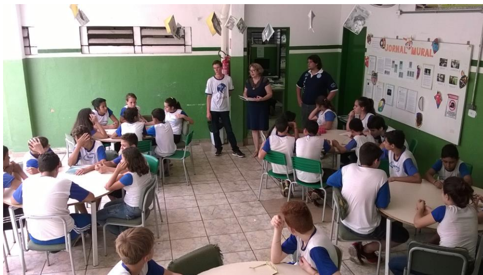
Foto 1: Professora supervisora orientando os educandos, juntamente com os bolsistas, para a realização do experimento.