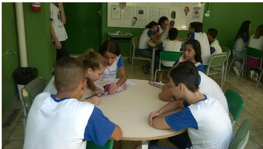
Foto 5: Educandos executando o experimento, com os testes das ligações.