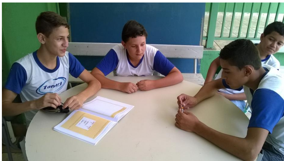
Foto 4: Educandos executando o experimento, com os testes das ligações.