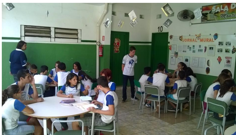
Foto 7: Alunos bolsistas orientando os educandos na realização do experimento.