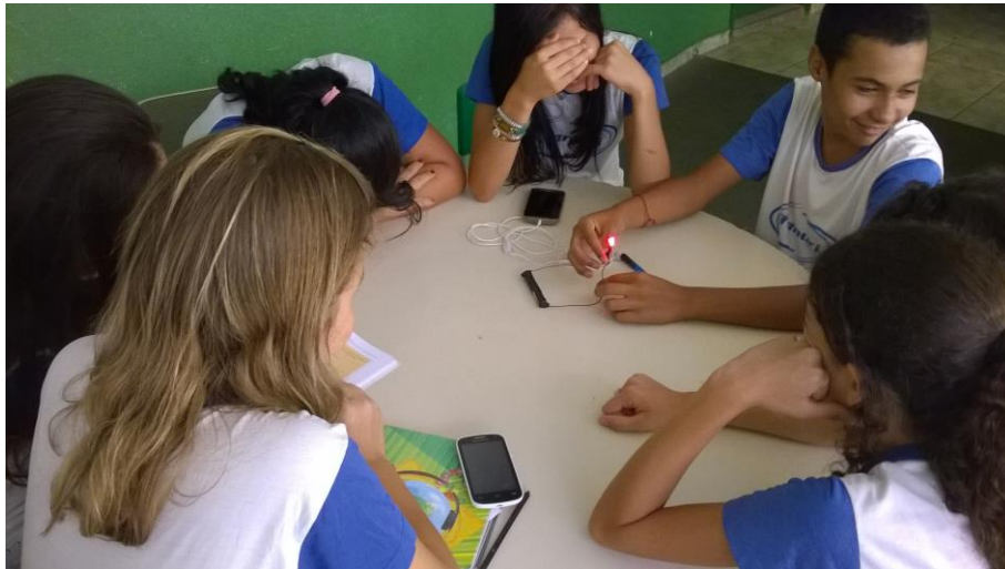
Foto 3: Educandos executando o experimento, com os testes das ligações.