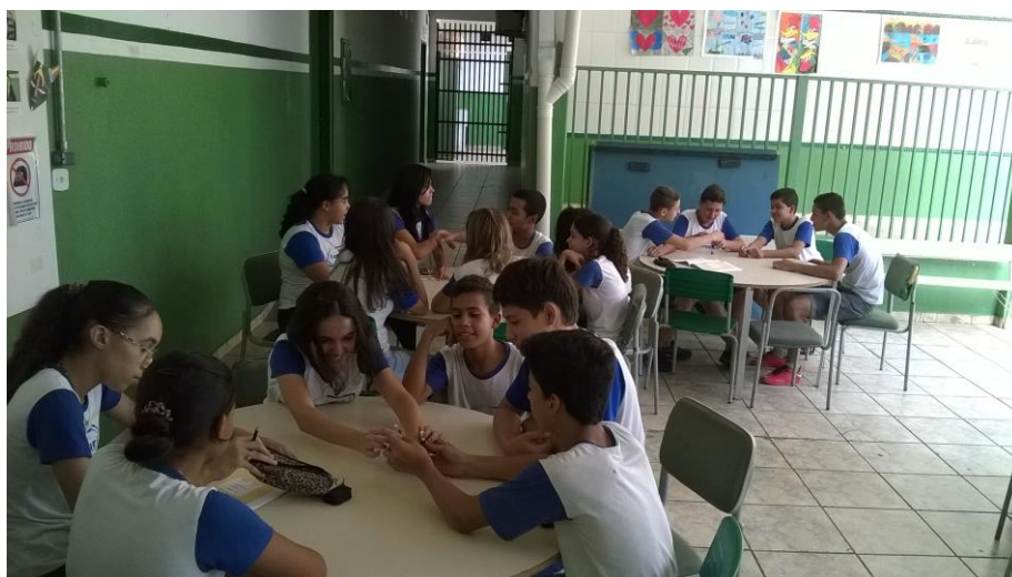
Foto 6: Educandos executando o experimento, com os testes das ligações.