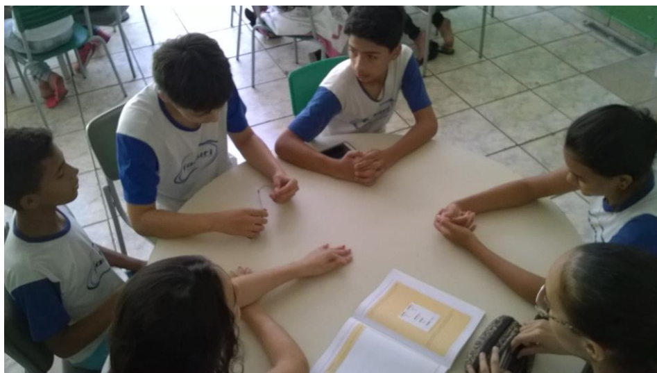
Foto 2: Educandos executando o experimento, com os testes das ligações.