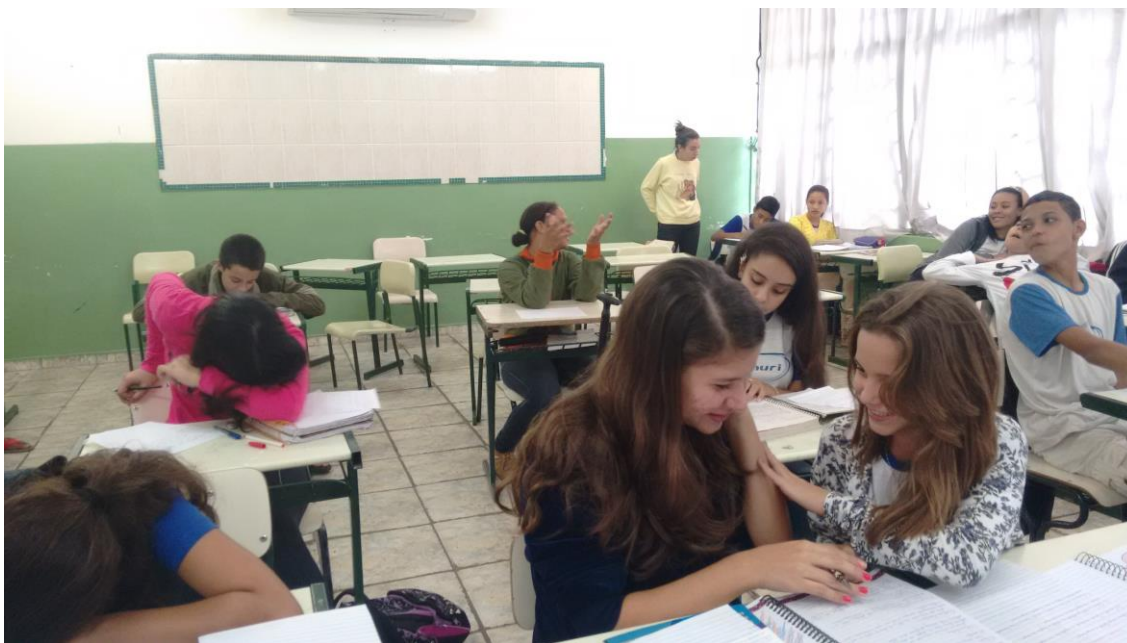
Foto 1: Confeção do Modelos do Sistema Circulatório, pelos educandos, orientados pela aluna bolsista.

Produção do Kit Pedagógico MODELOS DO SISTEMA CIRCULATORIO pelos educandos da 7ª série/8º ano do Ensino Fundamental do Ciclo II, orientados pelos alunos bolsistas e pelo professor supervisor, na unidade escolar, no mês de junho. O kit é composto por um modelo de um sistema circulatório, confeccionada com folha sulfite e lápis de cor. A finalidade é apresentar para os educandos a estrutura do sistema humano, melhorando assim a compreensão do funcionamento dos órgãos envolvidos.