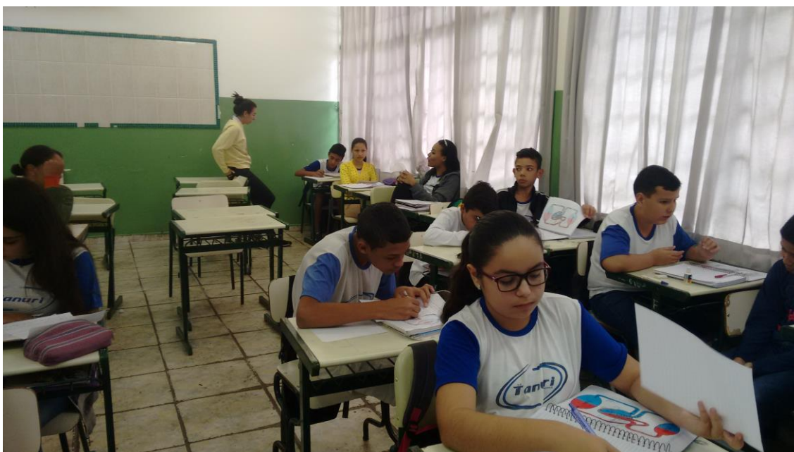
Foto 3: Confeção do Modelos do Sistema Circulatório, pelos educandos, orientados pela aluna bolsista.