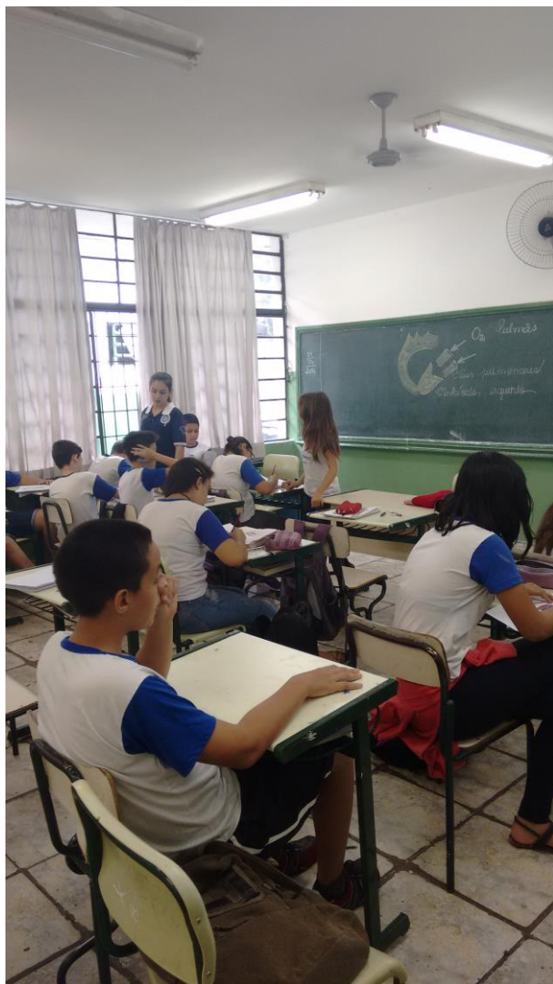
Foto 4: Confeção do Modelos do Sistema Circulatório, pelos educandos, orientados pela aluna bolsista.