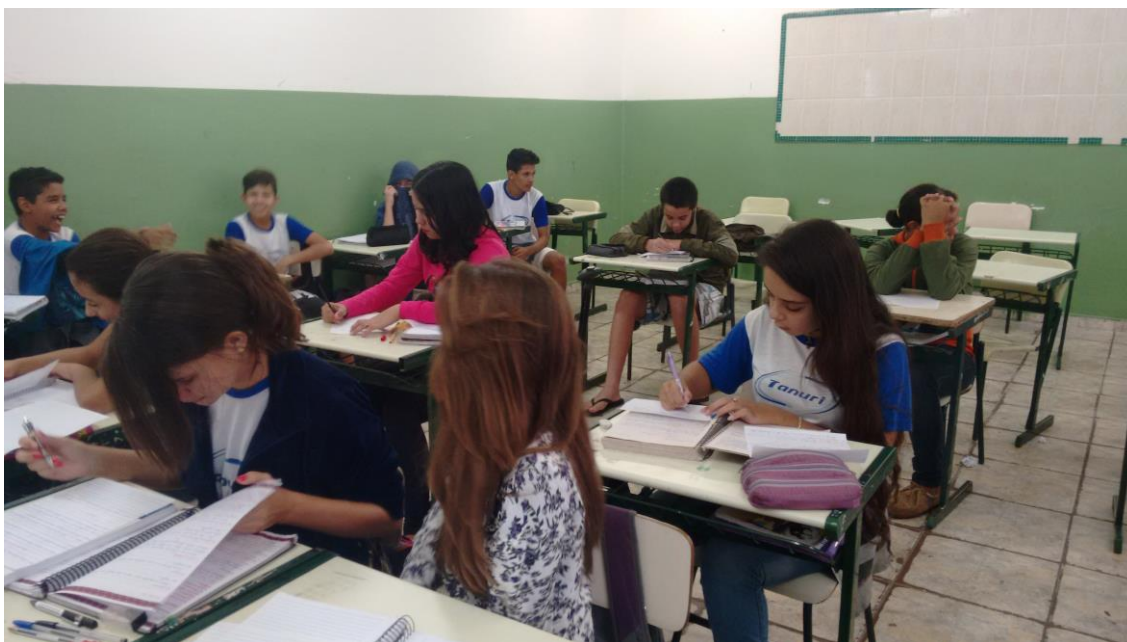
Foto 2: Confeção do Modelos do Sistema Circulatório, pelos educandos.