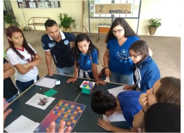
Figura 6 - Alunos durante o projeto.