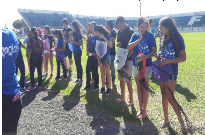
Figura 3 - Alunos demonstrando suas pipas.

Podemos concluir que o projeto teve resultados satisfatórios.