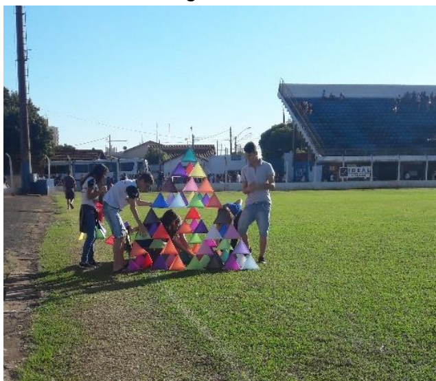
Figura 1 - Pipa Tetraédrica construída pelos alunos.

A grande atração do projeto, foi a pipa tetraédrica de Ghram Bell, formada por tetraedros regulares, e que agrega ensinamentos matemáticos como progressões geométricas, semelhança de triângulos e pirâmides, peso e volume de um tetraedro regular, entre outros.