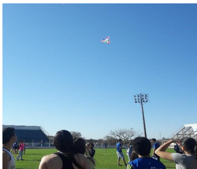
Figura 2 - Pipa Tetraédrica no ar.