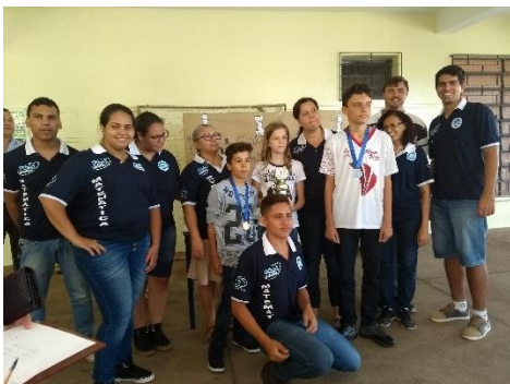
Figura 7 - Entrega de troféus e medalhas aos alunos.

Durante o campeonato, os alunos participantes ficaram bem concentrados no jogo, percebendo-se assim que esse tipo de atividade aprimora a concentração dos alunos, ajudando a trabalhar seu raciocínio lógico.