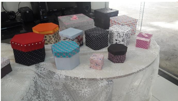
Figura 9- Algumas das caixas feitas pelos alunos.

Este trabalho foi acompanhado pelos alunos do PIBID, em sala de aula, auxiliando nas construções, nos cálculos matemáticos e tirando dúvidas, permitindo uma proximidade maior entre os alunos bolsistas e os alunos do ensino médio, havendo uma troca de experiências e uma maior compreensão de como ser um bom professor.