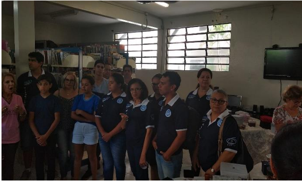
Figura 10 - Bidianos, alunos da EELAS e professores, durante a doação.