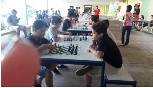
Figura 8 - Alunos durante o jogo.