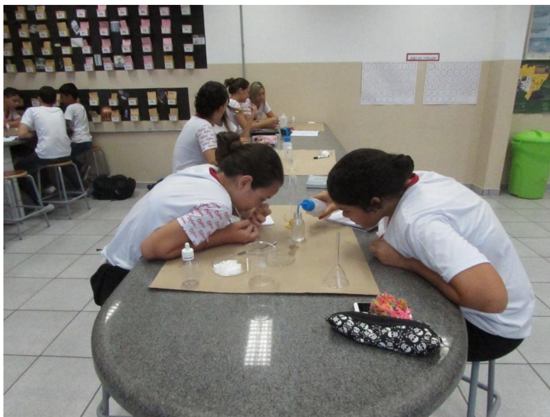
Fig.3- Aula prática sobre Densidade sendo desenvolvida