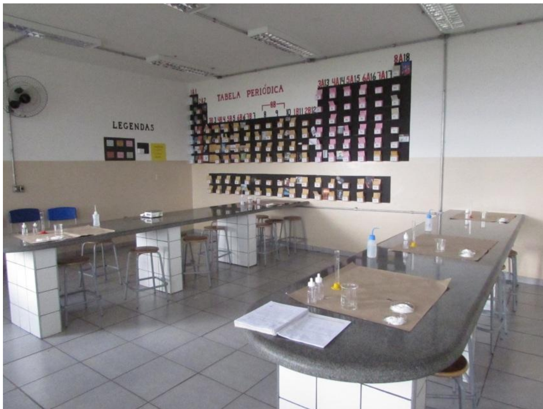
Fig.2- Aula prática de densidade pronta para ser executada pelos alunos da E. E. Afonso Cáfaro