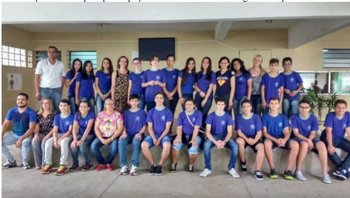
Foto 01: Equipe gestora, Professores e alunos premiados na 12ª OBMEP na EELAS

“Premiação EELAS pela participação na 12ª OBMEP e 3º lugar no Rapid Game”