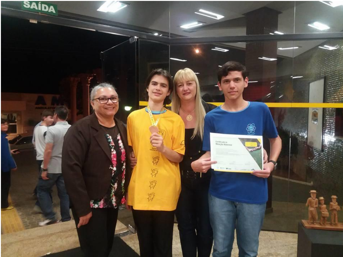
Foto 05: Coordenadora e Professora da EELAS com alunos premiadas na OBMEP Resultado da 13ª OBMEP em 2017 que irão receber a premiação em 2018.

Os alunos bolsistas foram monitores dos alunos da escola participante na Visita Técnica ao Observatório Astronômico da Unesp de Ilha Solteira em outubro de 2017, acompanhados da professora supervisora.