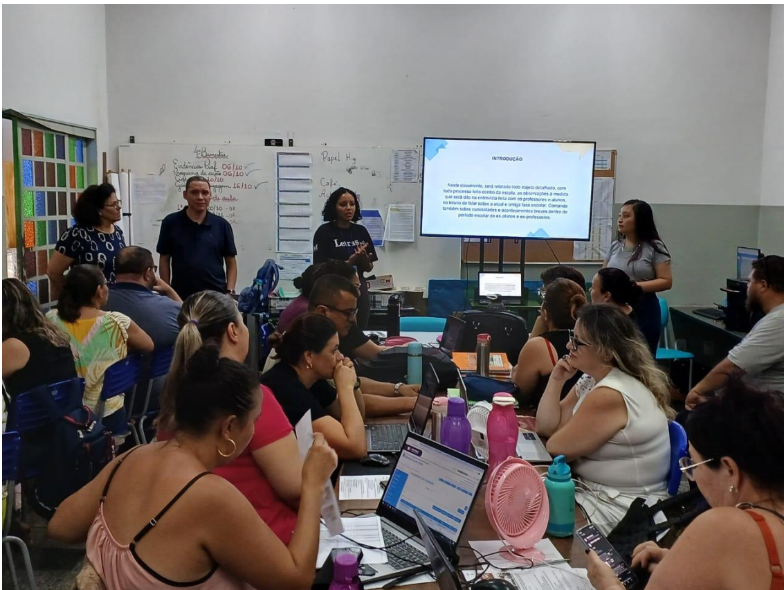
Escola Estadual Joaquim Antônio Pereira, outubro de 2023.