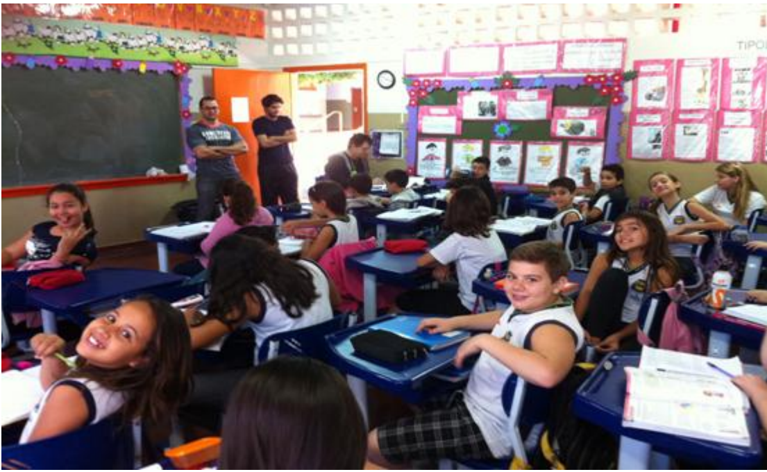
Aulas Teóricas -